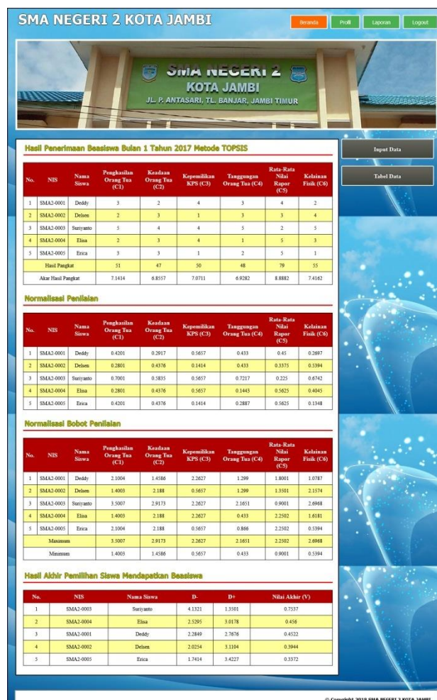
Gambar 5.12 Melihat Penerimaan Beasiswa