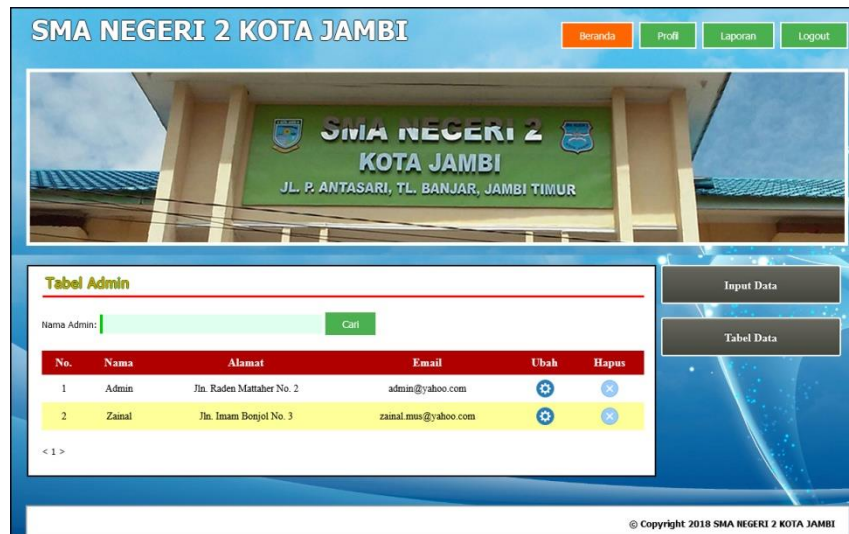
Gambar 5.7 Tabel Admin