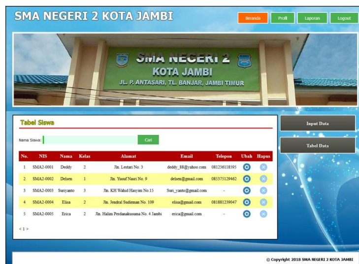
Gambar 5.8 Tabel Siswa

Halaman tabel siswa menampilkan data siswa yang telah diinput oleh pengguna sistem serta terdapat bantuan untuk mengubah dan menghapus data siswa pada sistem. Gambar 5.8 tabel siswa merupakan hasil implementasi dari rancangan pada Gambar 4.29.