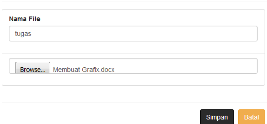
Gambar 5.10 Tampilan Tambah Materi