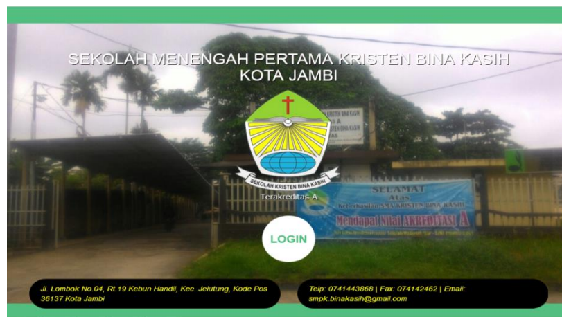
Gambar 5.1 Tampilan Halaman Utama

Berikut adalah tampilan hasil implementasinya :