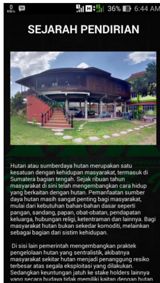
Gambar 5.2 Tampilan Menu Sejarah Warsi

Halaman tampilan menu sejarah warsi ditampilkan oleh sistem jika user memilih menu sejarah warsi. Halaman menu sejarah warsi ini merupakan implementasi dari rancangan pada gambar 4.8, sedangkan listing program ada pada lampiran.. Tampilan halaman menu sejarah warsi ini dapat dilihat pada gambar 5.1 dibawah ini: