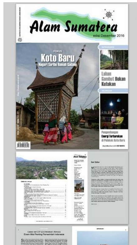
Gambar 5.5 Tampilan Buku