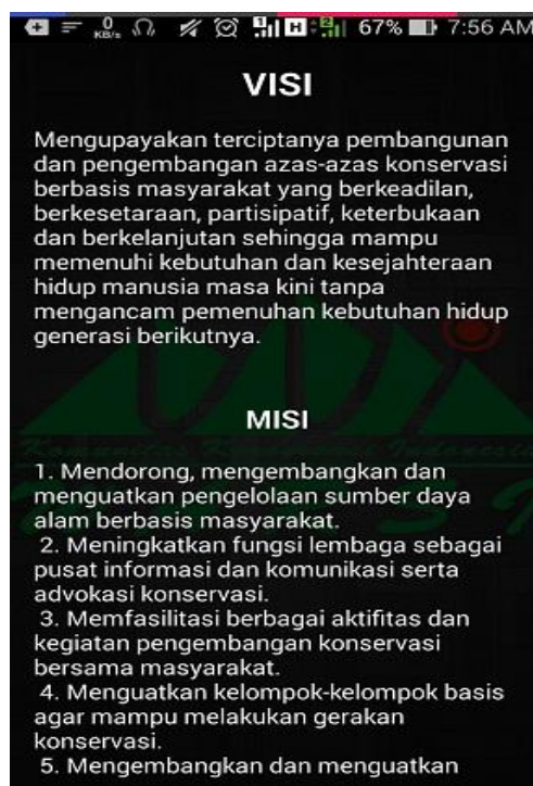
Gambar 5.3 Tampilan Menu Visi dan Misi Warsi

Halaman tampilan menu visi dan misi warsi ditampilkan oleh sistem jika user memilih menu visi dan misi warsi. Halaman visi dan misi warsi ini merupakan implementasi dari rancangan pada gambar 4.9, sedangkan listing program ada pada lampiran. Tampilan halaman visi dan misi warsi itu dapat dilihat pada gambar 5.3 dibawah ini: