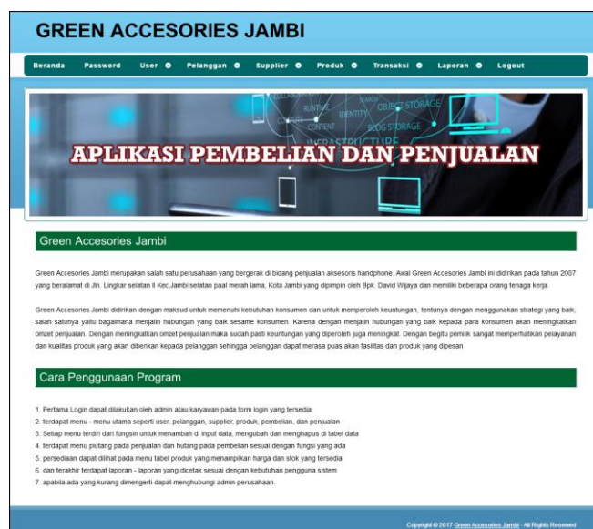
Gambar 5.1 Halaman Beranda Admin

Halaman beranda admin merupakan halaman pertama setelah admin melakukan login dimana halaman ini menampilkan gambaran umum dari perusahaan, cara penggunaan sisem dan terdapat menu-menu untuk menampilkan informasi yang lain. Gambar 5.1 beranda admin merupakan hasil implementasi dari rancangan pada gambar 4.32