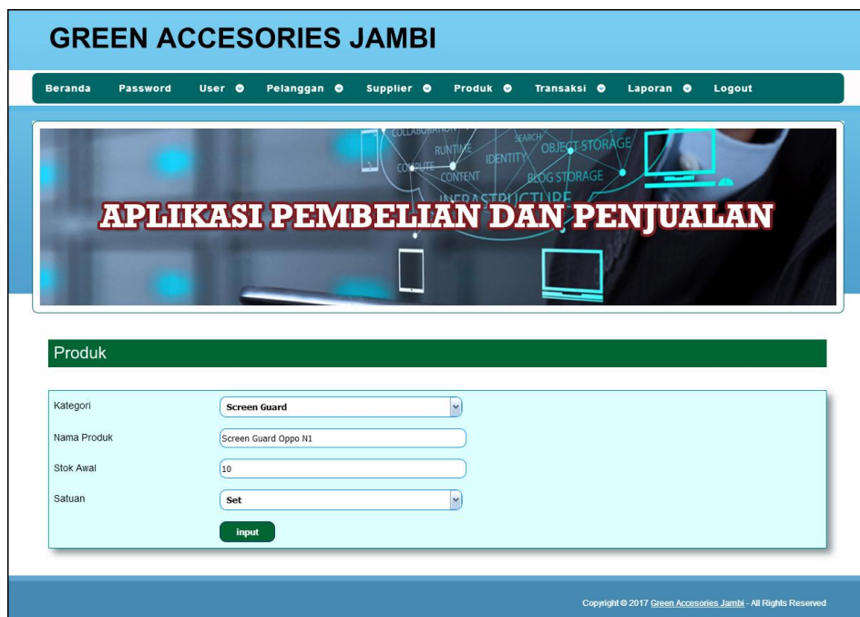
Gambar 5.15 Input Produk

Halaman input produk merupakan halaman yang digunakan admin untuk menambah data produk dengan kode produk, nama produk, stok awal dan satuan di kolom yang tersedia. Gambar 5.15 input produk merupakan hasil implementasi dari rancangan pada gambar 4.46.