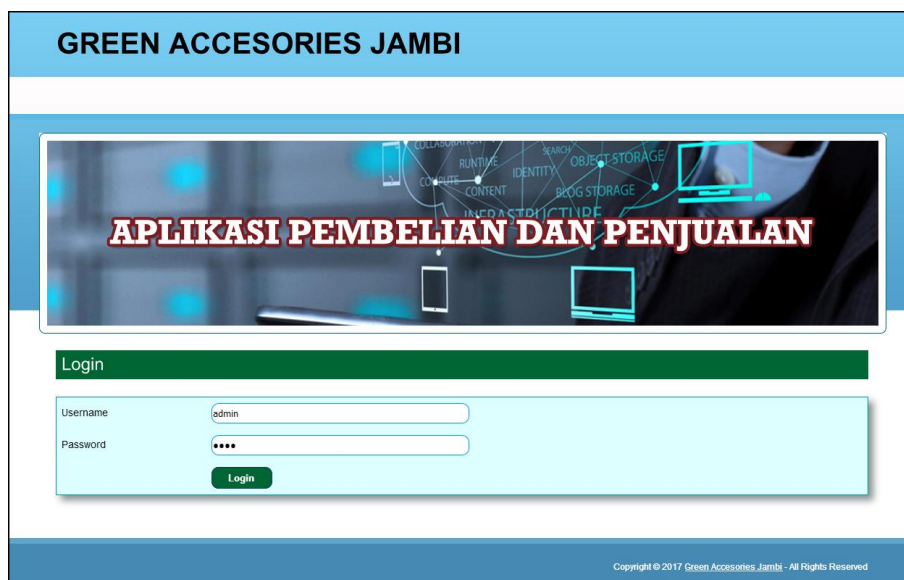
Gambar 5.11 Form Login

Halaman form login merupakan halaman yang digunakan admin atau karyawan untuk masuk ke halaman utama dengan mengisi username dan password di kolom yang tersedia. Gambar 5.11 form login merupakan hasil implementasi dari rancangan pada gambar 4.42.