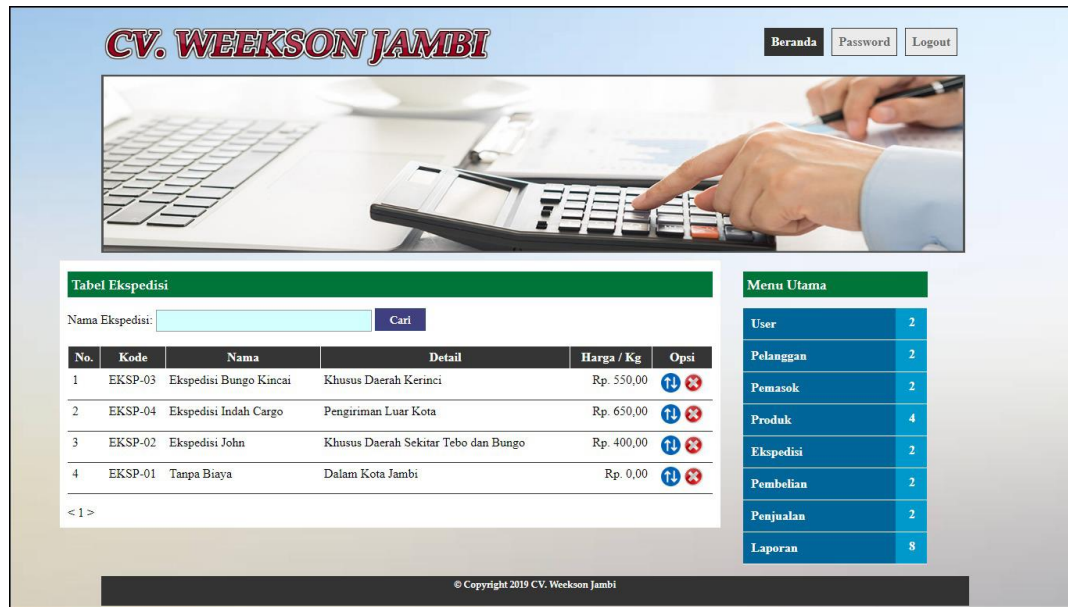
Gambar 5.6 Form Ekspedisi