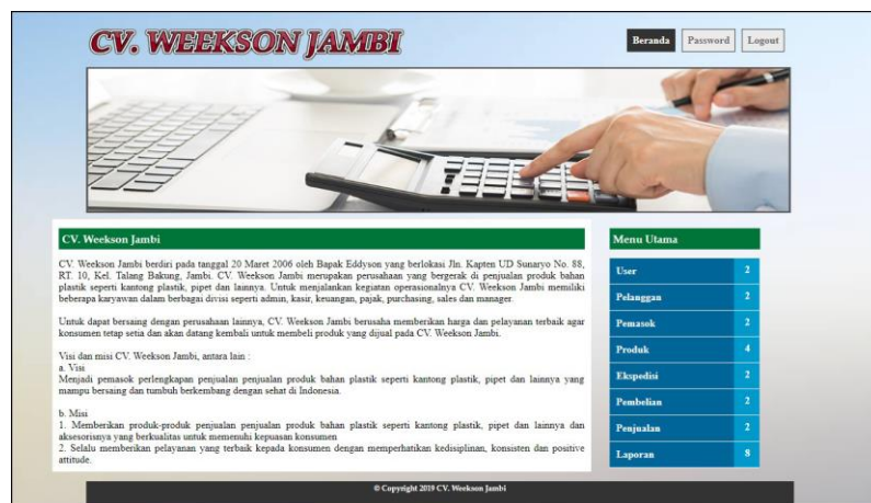
Gambar 5.1 Beranda

Gambar 5.1 merupakan hasil implementasi dari rancangan pada gambar 4.31.