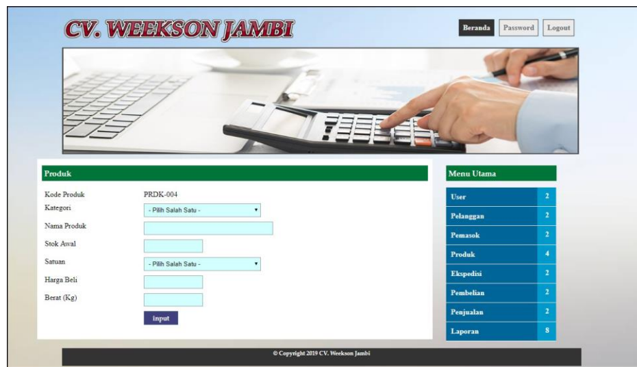
Gambar 5.16 Input Produk

Halaman input produk merupakan halaman yang digunakan oleh admin untuk menambah data produk baru ke dalam sistem dengan dimana admin diwajibkan mengisi kategori, nama produk, stok awal, satuan, harga beli, dan berat (kg) pada field yang telah tersedia pada sistem. Gambar 5.16 merupakan hasil implementasi dari rancangan pada gambar 4.46.