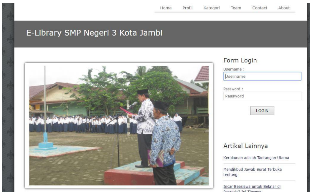
Gambar 5.5 Tampilan Halaman Utama

Halaman menu utama merupakan Tampilan Awal program sebelum program itu di jalankan. Adapun tampilan halaman utama dapat di dilihat pada gambar berikut :