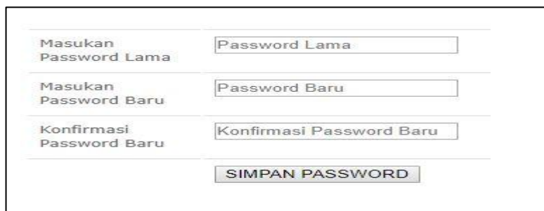
Gambar 5.4 Tampilan Halaman Ganti password Anggota

Adapun halaman ganti password admin dapat dilihat pada gambar berikut :