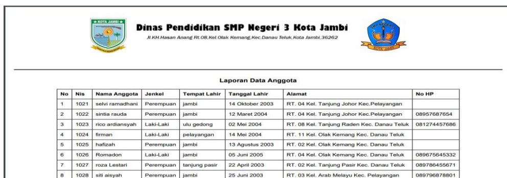
Gambar 5.6 Tampilan Halaman output laporan anggota

Halaman output laporan anggota merupakan halaman yang digunakan oleh pengguna untuk melihat data-data anggota Perpustakaan yang ada di SMP Negeri 3 kota jambi. Adapun bentuk halaman dapat dilihat seperti pada gambar berikut :