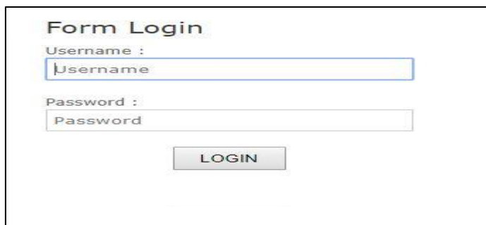
Gambar 5.2 Tampilan Halaman Login Anggota

Adapun halaman login anggota dapat dilihat pada gambar berikut :