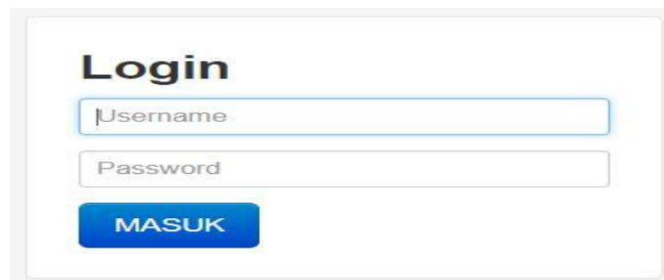
Gambar 5.1 Tampilan halaman Login admin

Adapun halaman login admin dapat dilihat pada gambar berikut :