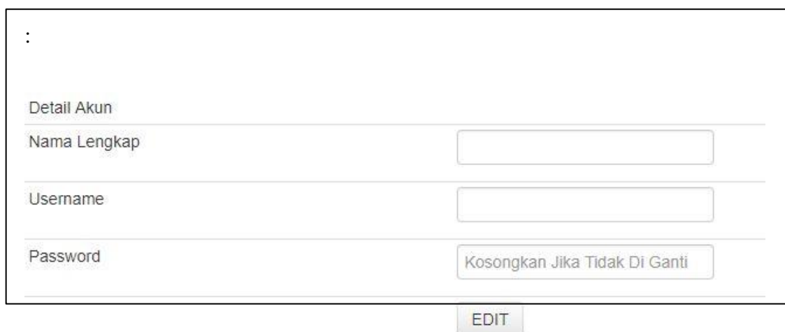
Gambar 5.3 Tampilan Halaman Ganti password Admin

Adapun halaman ganti password admin dapat dilihat pada gambar berikut