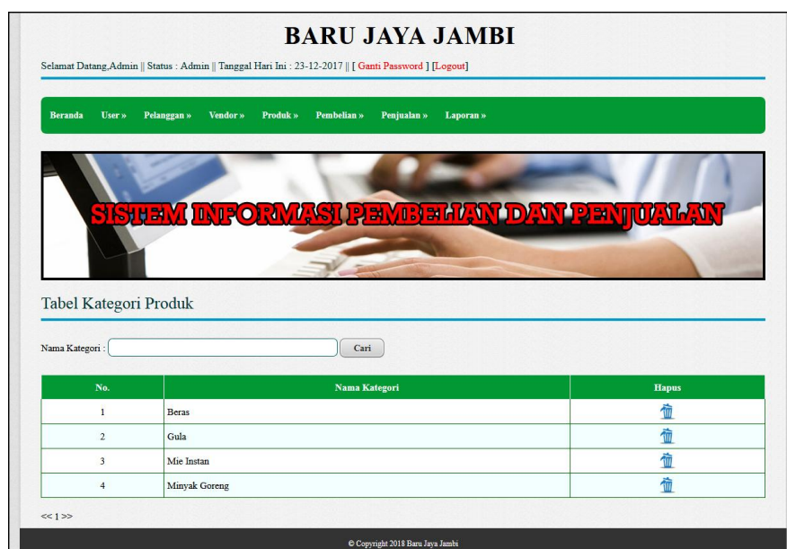
Gambar 5.13 Tabel Kategori Produk

Halaman tabel kategori produk merupakan halaman yang digunakan untuk mengelola data kategori produk dengan menampilkan informasi mengenai kategori produk dan terdapat link untuk menghapus data kategori produk. Gambar 5.13 tabel kategori produk merupakan hasil implementasi dari rancangan pada gambar 4.40.