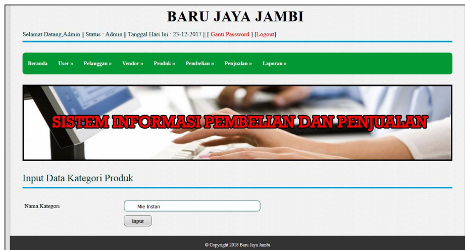
Gambar 5.4 Input Kategori Produk

Halaman input kategori produk merupakan halaman yang digunakan admin untuk menambah data kategori produk dengan mengisi nama kategori produk di kolom yang tersedia. Gambar 5.4 input kategori produk merupakan hasil implementasi dari rancangan pada gambar 4.31.