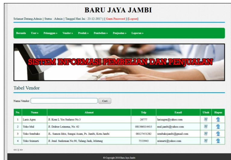
Gambar 5.12 Tabel Vendor

Halaman tabel vendor merupakan halaman yang digunakan untuk mengelola data vendor dengan menampilkan informasi mengenai vendor dan terdapat link untuk mengubah dan menghapus data vendor. Gambar 5.12 tabel supplier merupakan hasil implementasi dari rancangan pada gambar 4.39.