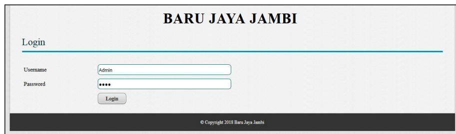
Gambar 5.1 Login

Halaman login merupakan halaman yang digunakan admin atau karyawan untuk masuk ke halaman utama dengan mengisi username dan password di kolom yang tersedia. Gambar 5.1 login merupakan hasil implementasi dari rancangan pada gambar 4.28.