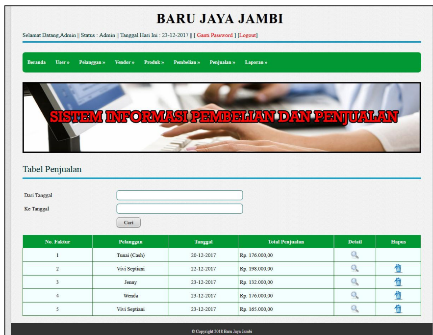
Gambar 5.16 Tabel Penjualan

Halaman tabel penjualan merupakan halaman yang digunakan untuk menampilkan data penjualan berdasarkan tanggal yang dipilih dan terdapat link untuk melihat detail dan menghapus data penjualan. Gambar 5.16 tabel penjualan merupakan hasil implementasi dari rancangan pada gambar 4.43.