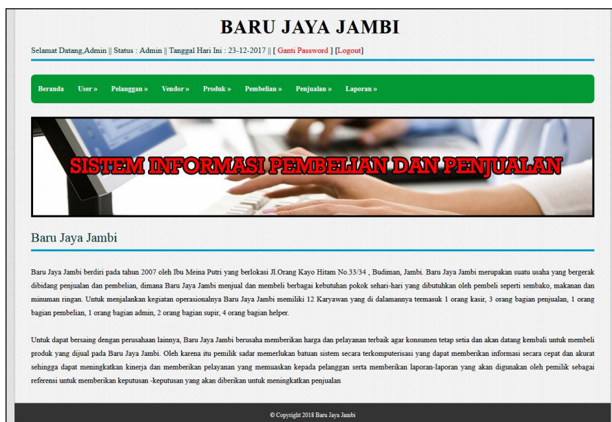
Gambar 5.40 Halaman Beranda

Halaman beranda merupakan halaman pertama setelah admin atau karyawan melakukan login dimana halaman ini menampilkan gambaran umum dari perusahaan, cara penggunaan sistem dan terdapat menu-menu untuk menampilkan informasi yang lain. Gambar 5.10 beranda admin merupakan hasil implementasi dari rancangan pada gambar 4.37