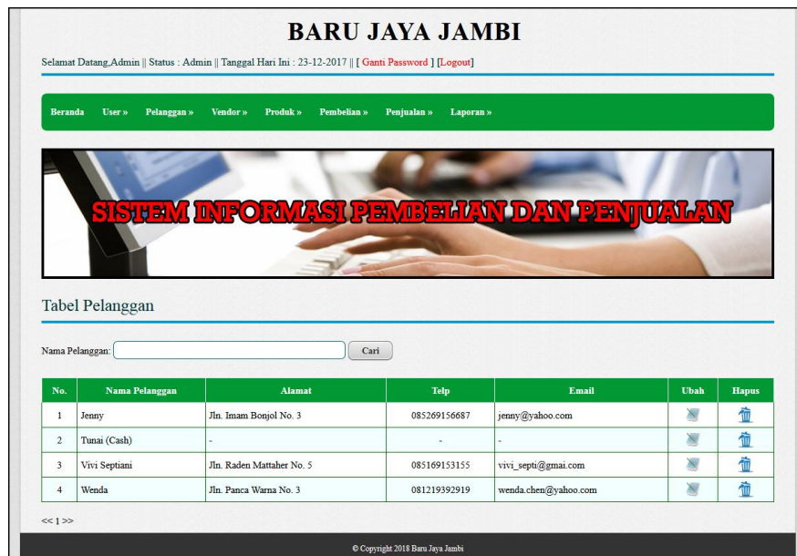
Gambar 5.11 Tabel Pelanggan