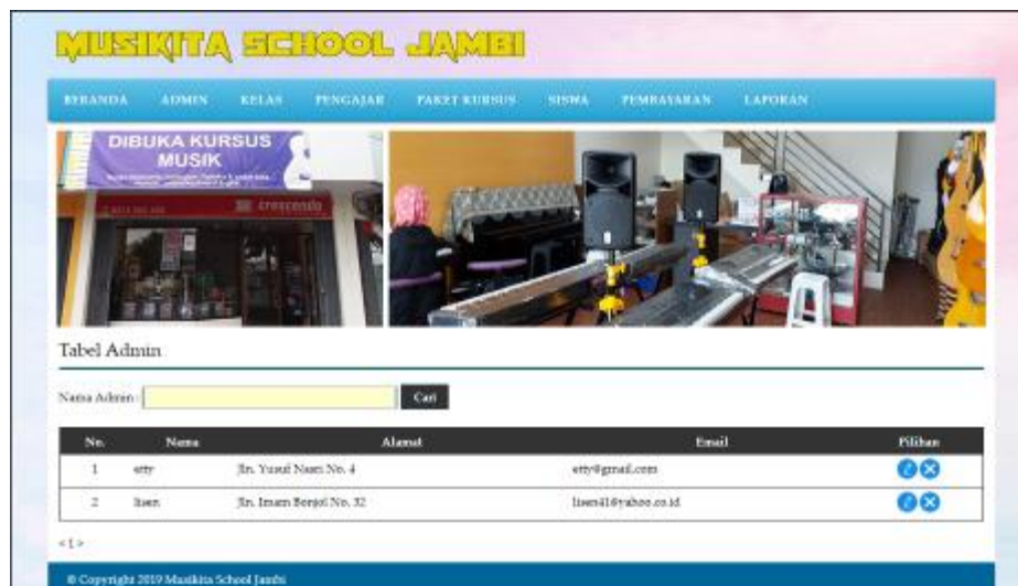
Gambar 5.8 Data Admin

Halaman data admin menampilkan informasi mengenai data admin yang terdapat nama, alamat, email dan terdapat link pilihan untuk mengubah dan menghapus data admin. Gambar 5.8 data admin merupakan hasil implementasi dari rancangan pada gambar 4.26