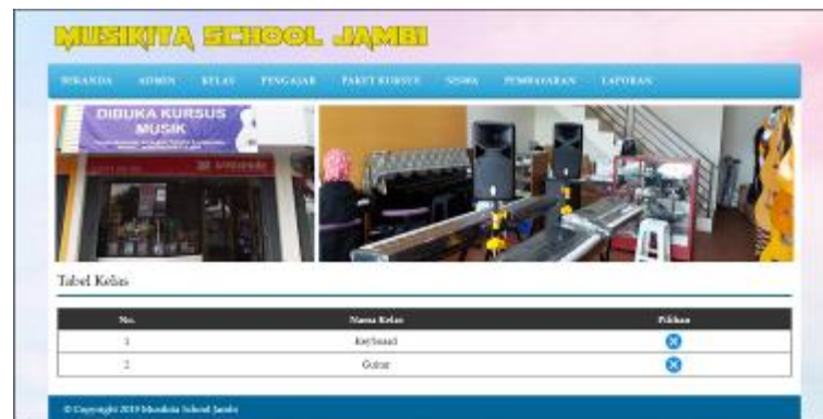
Gambar 5.9 Data Kelas

Halaman data kelas menampilkan informasi mengenai data kelas yang terdapat nama kelas dan terdapat link pilihan untuk menghapus data kelas. Gambar 5.9 data admin merupakan hasil implementasi dari rancangan pada gambar 4.27