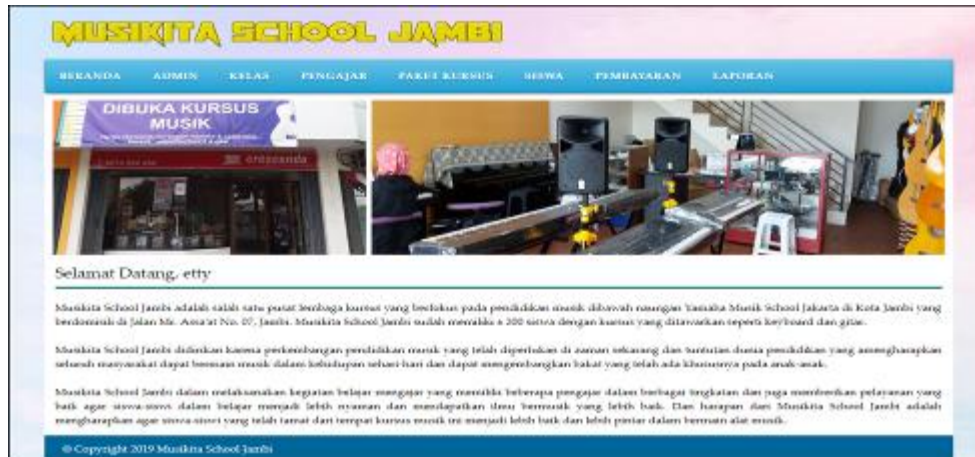
Gambar 5.7 Beranda