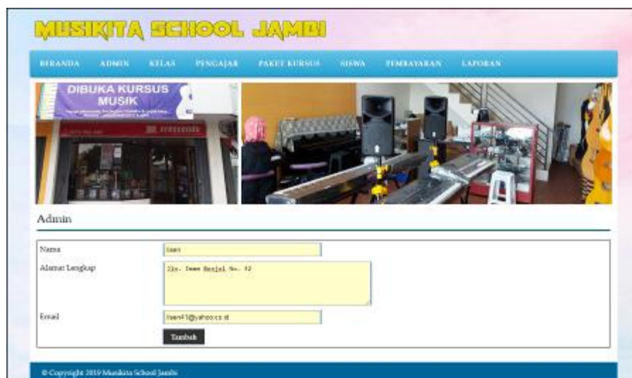
Gambar 5.2 Tambah Admin

Gambar 5.2 tambah admin merupakan hasil implementasi dari rancangan pada gambar 4.35