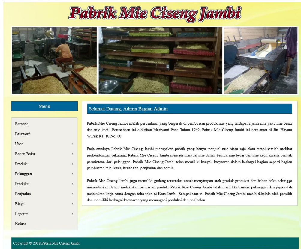
Gambar 5.10 Halaman Beranda

berisikan informasi mengenai Pabrik Mie Ciseng Jambi. Gambar 5.10 merupakan hasil implementasi dari rancangan pada gambar 4.42.