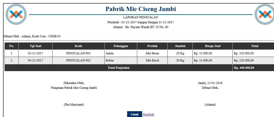
Gambar 5.3 Halaman Laporan Penjualan

halaman laporan penjualan merupakan halaman yang berisikan informasi mengenai data penjualan yang telah diinput dengan menampilkan no, tgl jual, kode, pelanggan, produk, jumlah, harga jual dan total. Gambar 5.12 laporan penjualan merupakan hasil implementasi dari rancangan pada gambar 4.44