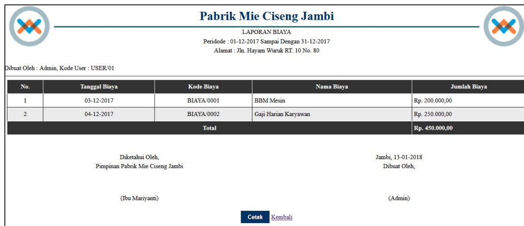
Gambar 5.13 Halaman Laporan Biaya

halaman laporan biaya merupakan halaman yang berisikan informasi mengenai data biaya yang telah diinput dengan menampilkan no, tanggal biaya, kode biaya, nama biaya, dan jumlah biaya. Gambar 5.13 laporan biaya merupakan hasil implementasi dari rancangan pada gambar 4.45.