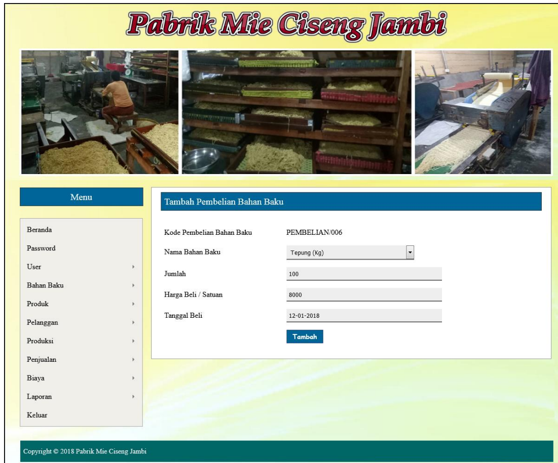
Gambar 5.7 Halaman Tambah Pembelian Bahan Baku