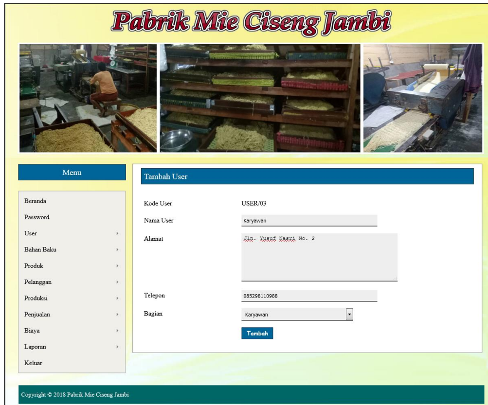
Gambar 5.5 Halaman Tambah User