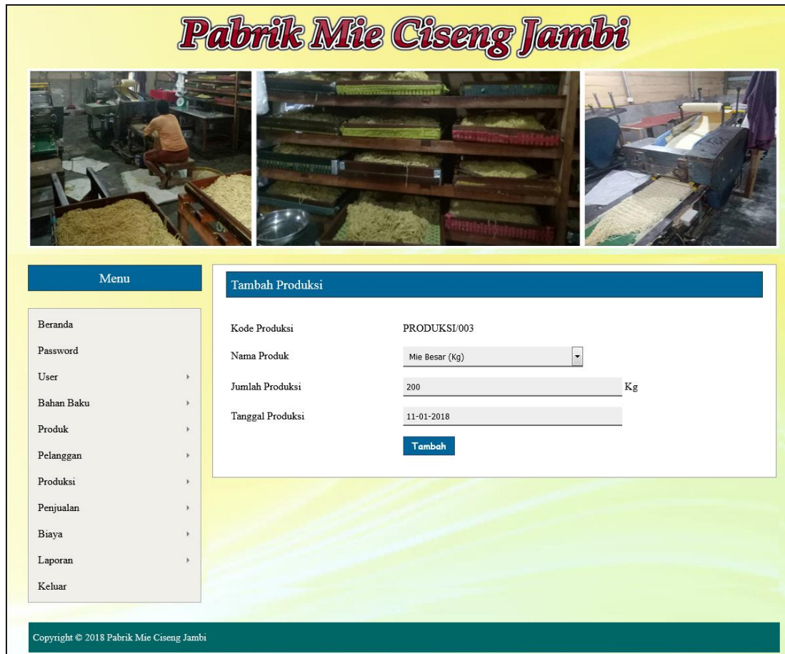
Gambar 5.8 Halaman Tambah Produksi