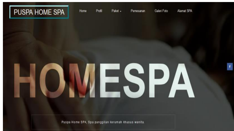
Gambar 5.4 Hasil Rancangan Menu Utama (Pelanggan)