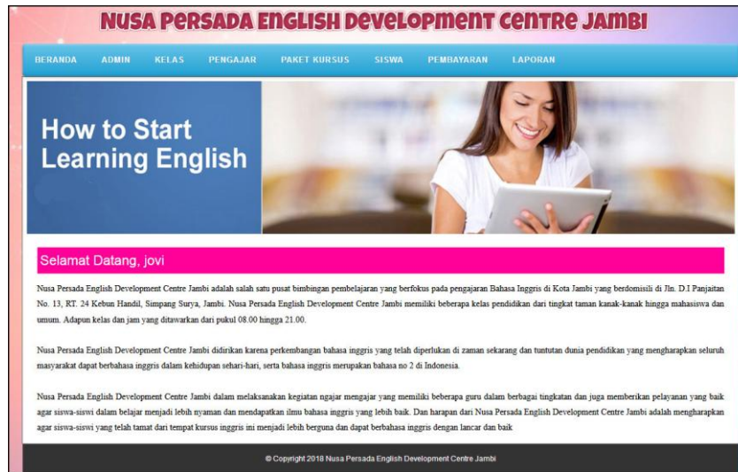
Gambar 5.7 Beranda