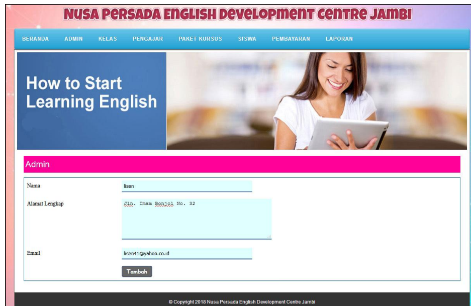
Gambar 5.2 Tambah Admin

Halaman tambah admin berisikan form untuk menambah admin baru yang terdapat field nama, alamat lengkap dan email yang wajib diisi di dalam sistem. Gambar 5.2 tambah admin merupakan hasil implementasi dari rancangan pada gambar 4.26