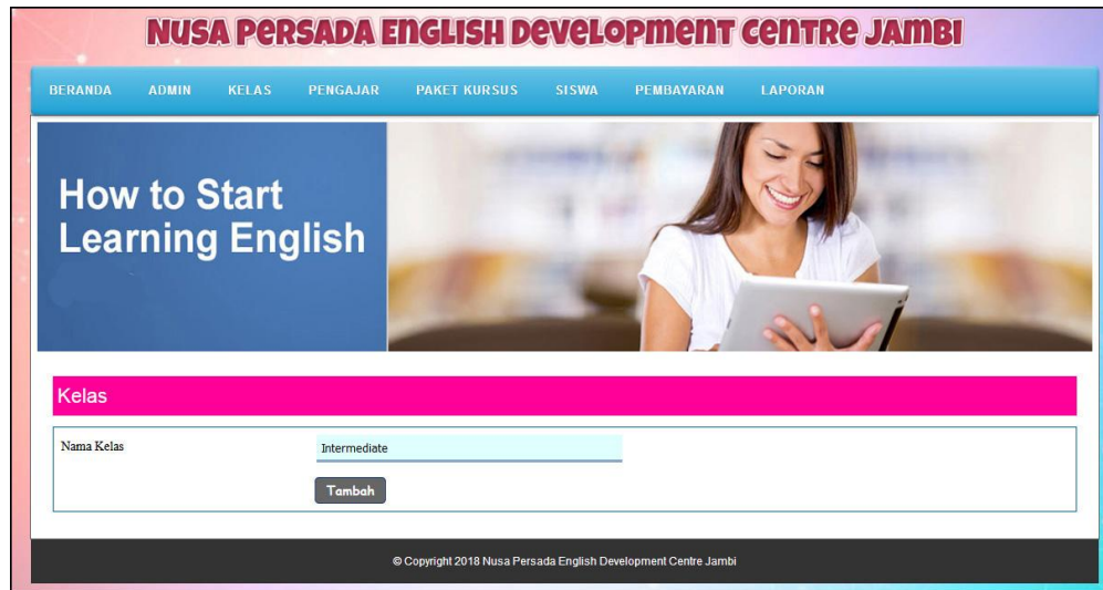
Gambar 5.3 Tambah Kelas