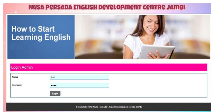
Gambar 5.1 Form Login

Halaman form login merupakan halaman yang digunakan oleh admin untuk masuk ke dalam halaman utama dengan mengisi nama dan password di form login yang tersedia dengan benar. Gambar 5.1 Form Login merupakan hasil implementasi dari rancangan pada gambar 4.25