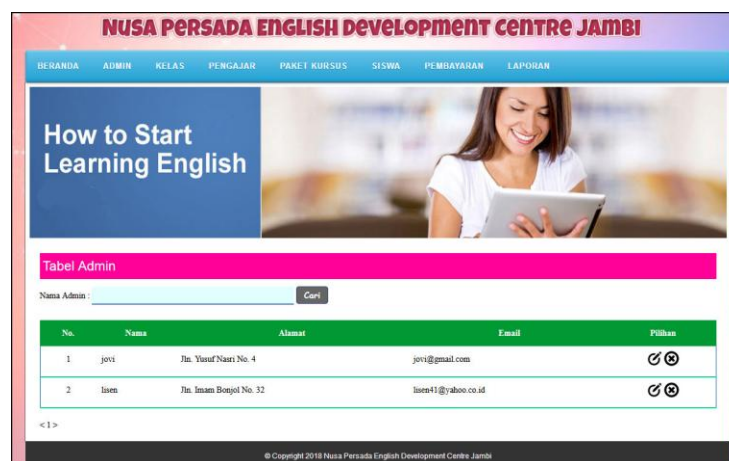
Gambar 5.8 Data Admin

Halaman data admin menampilkan informasi mengenai data admin yang terdapat nama, alamat, email dan terdapat link pilihan untuk mengubah dan menghapus data admin. Gambar 5.8 data admin merupakan hasil implementasi dari rancangan pada gambar 4.32