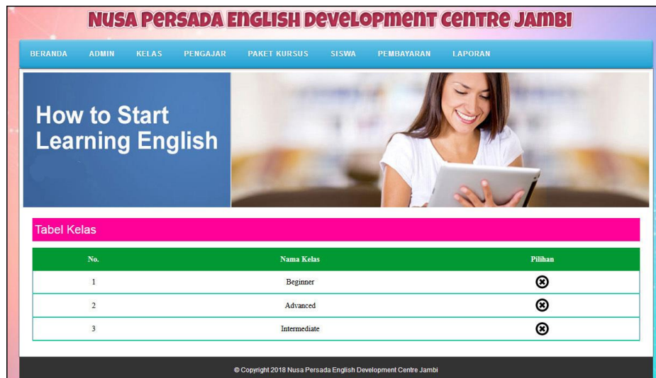
Gambar 5.9 Data Kelas

Halaman data kelas menampilkan informasi mengenai data kelas yang terdapat nama kelas dan terdapat link pilihan untuk menghapus data kelas. Gambar 5.9 data admin merupakan hasil implementasi dari rancangan pada gambar 4.33