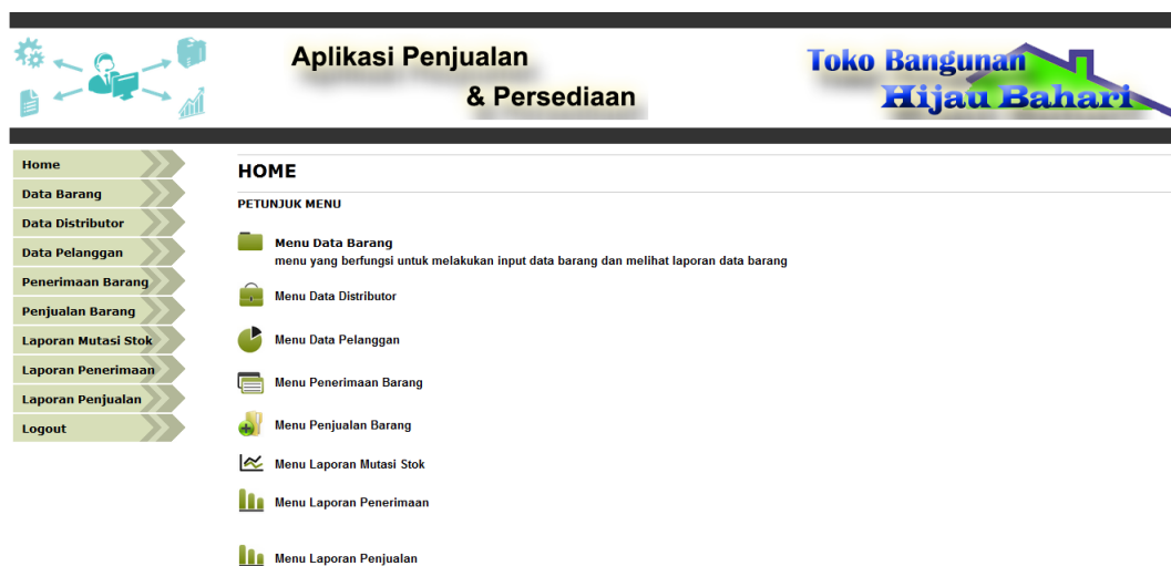
Gambar 5.1 Halaman Home

Halaman home ini adalah halaman yang ditampilkan oleh sistem setelah admin melakukan login. Pada halaman ini ditampilkan menu-menu yang dapat dipilih oleh admin serta teks petunjuk menu sistem.