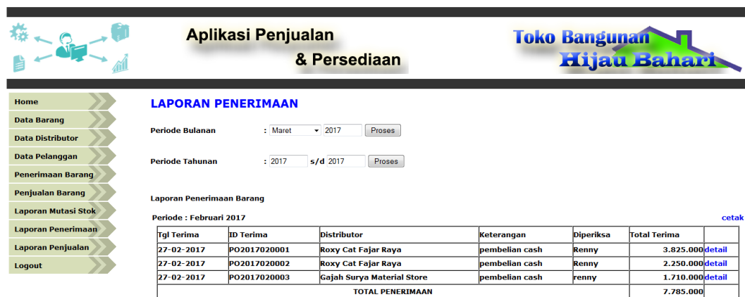
Gambar 5.14. Halaman Laporan Penerimaan Barang per bulan

Halaman halaman laporan penerimaan barang merupakan halaman utama untuk menampilkan data-data penerimaan barang pada periode tertentu. Pada halaman ini ditampilkan antarmuka sistem untuk inputan periode dan sistem akan menampilkan laporan penerimaan barang sesuai periode yang dipilih.