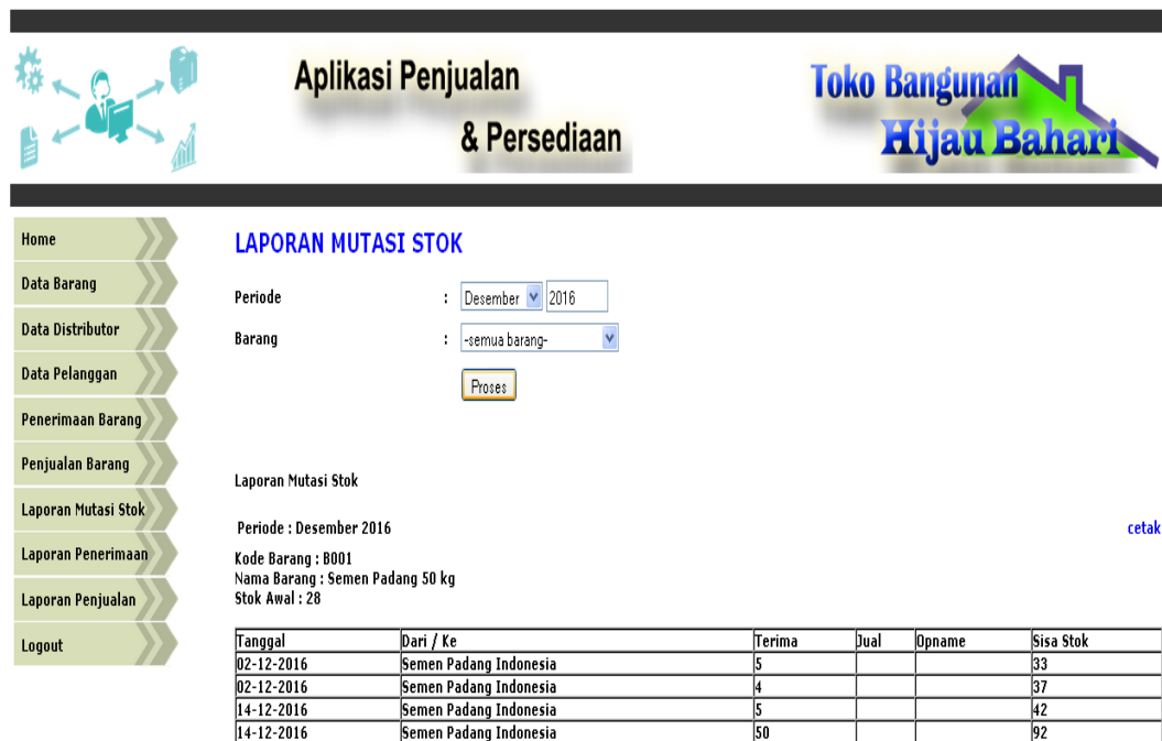
Gambar 5.8. Halaman Laporan Mutasi Stok Per Barang