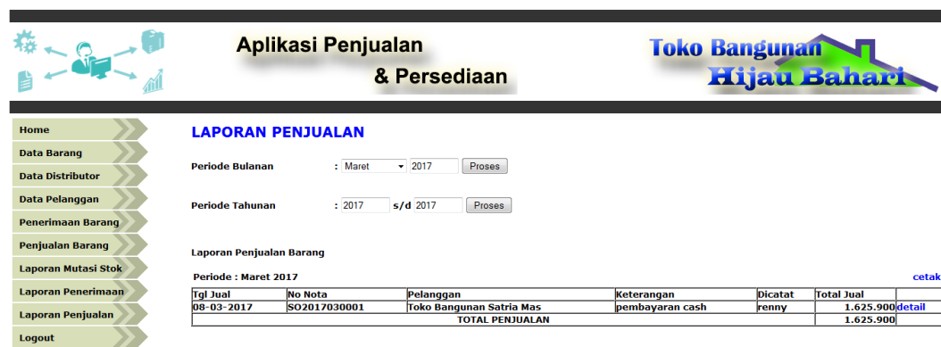
Gambar 5.10. Halaman Laporan Penjualan Barang per bulan

Halaman halaman laporan penjualan barang ini merupakan halaman utama untuk menampilkan data penjualan barang pada periode tertentu. Pada halaman ini ditampilkan antarmuka sistem untuk inputan periode dan sistem akan menampilkan laporan penjualan barang sesuai periode yang dipilih.