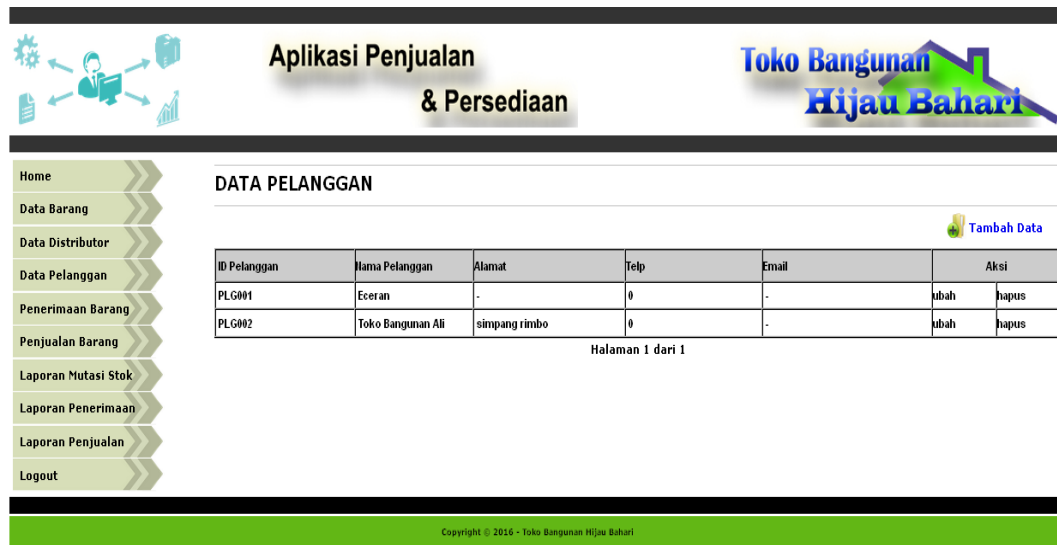
Gambar 5.5. Halaman Data Pelanggan