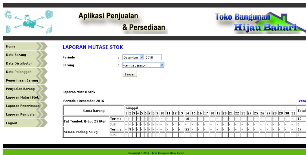
Gambar 5.6. Halaman Laporan Mutasi Stok

Halaman laporan mutasi stok merupakan halaman utama untuk menampilkan data-data mutasi stok barang pada periode tertentu. Pada halaman ini ditampilkan antarmuka untuk memilih periode dan barang tertentu, dan sistem akan menampilkan laporan mutasi stok sesuai dengan pilihan dari admin.