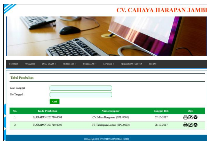
Gambar 5.2 Tabel Pembelian

Halaman tabel pembelian merupakan halaman yang menampilkan informasi pembelian yang telah diinput dan terdapat opsi untuk mengubun dan menghapus data pembelian. Gambar 5.2 tabel pembelian merupakan hasil implementasi dari rancangan pada gambar 4.35.