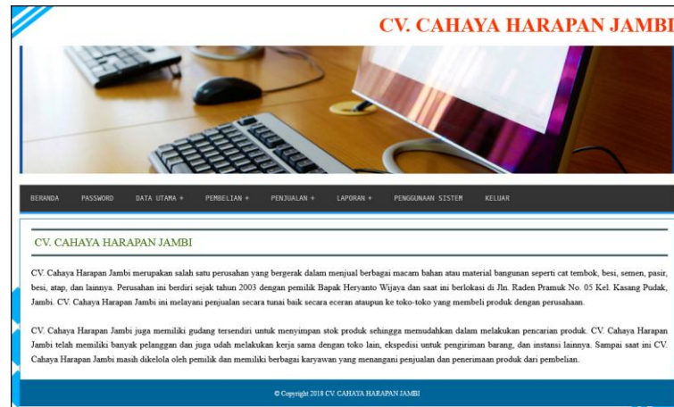
Gambar 5.1 Beranda