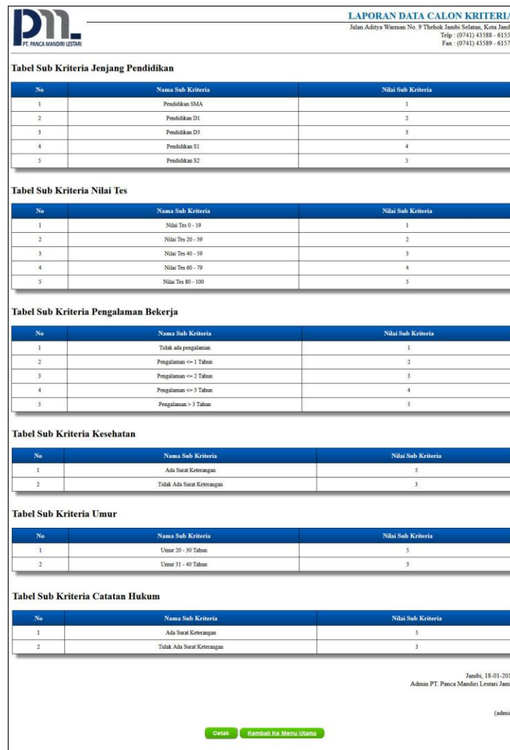
Gambar 5.11 Laporan Sub Kriteria

Halaman laporan sub kriteria merupakan tampilan yang berisikan data sub kriteria yang dapat dicetak sesuai dengan kebutuhannya. Gambar 5.11 laporan sub kriteria merupakan hasil implementasi dari rancangan pada gambar 4.35