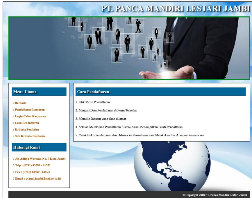
Gambar 5.13 Cara Pendaftaran