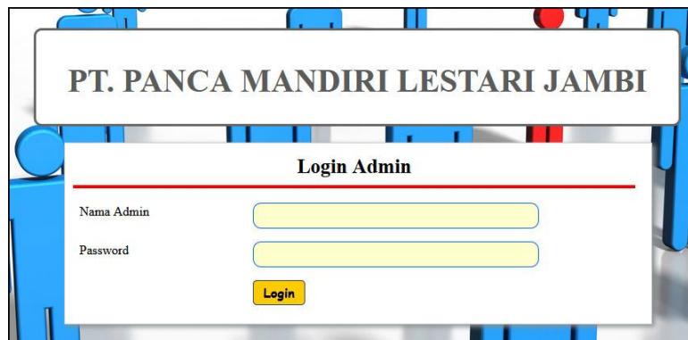
Gambar 5.1 Form Login

Halaman form login merupakan halaman yang berisikan field yang harus diisi yaitu nama admin dan password yang digunakan untuk masuk ke dalam halaman utama. Gambar 5.1 form login merupakan hasil implementasi dari rancangan pada gambar 4.25