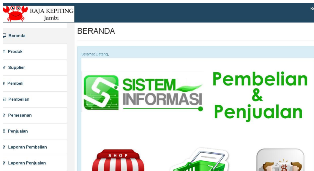
Gambar 5.1 Halaman Beranda

Halaman beranda ini adalah halaman yang ditampilkan oleh sistem setelah admin melakukan login. Halaman beranda ini merupakan hasil implementasi dari halaman pada gambar 4.17. Pada halaman ini ditampilkan logo dan pada bagian kiri halaman ditampilkan menu-menu yang dapat dipilih oleh admin.