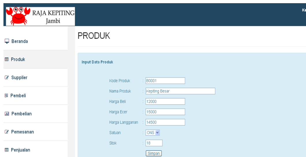
Gambar 5.9 Halaman Master Produk

Halaman master produk ini adalah halaman utama untuk pencatatan data-data produk. Halaman master produk ini merupakan implementasi dari rancangan input master produk pada gambar 4.25. Pada halaman ini ditampilkan kotak-kotak teks yang berfungsi sebagai inputan data produk.