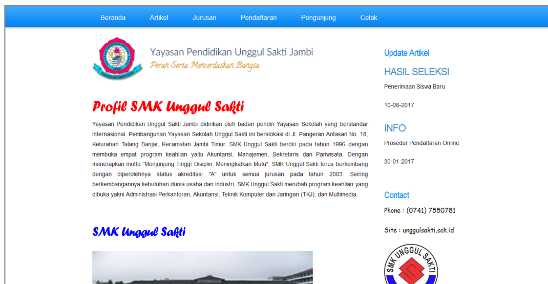
Gambar 5.1 Implementasi Form Menu Utama

Form menu utama digunakan untuk mengakses form - form yang tersedia. Dari tampilan form menu utama, pengguna dapat mengakses form lain sesuai dengan fungsionalitas yang disediakan sistem dan dapat dipilih pada baris menu. Berikut adalah gambar 5.1 hasil implementasi dari perancangan gambar 4.17.