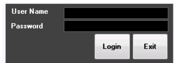
Gambar 5.1 Implementasi Form Login

Form login merupakan tampilan awal saat program di jalankan, form login digunakan sebagai tingkat pengguna dan keamanan. Data login terdiri dari lebel, username , password . Berikut hasil implemtasi dari form login dapat dilihat pada gambar 5.1 :