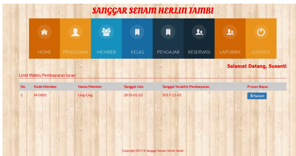
Gambar 5.1 Halaman Home

Halaman home merupakan halaman yang menghubungkan pengguna ke sub sistem yang diinginkan. Gambar 5.1 merupakan hasil implementasi dari rancangan pada gambar 4.26.