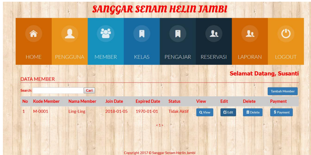
Gambar 5.3 Halaman Member