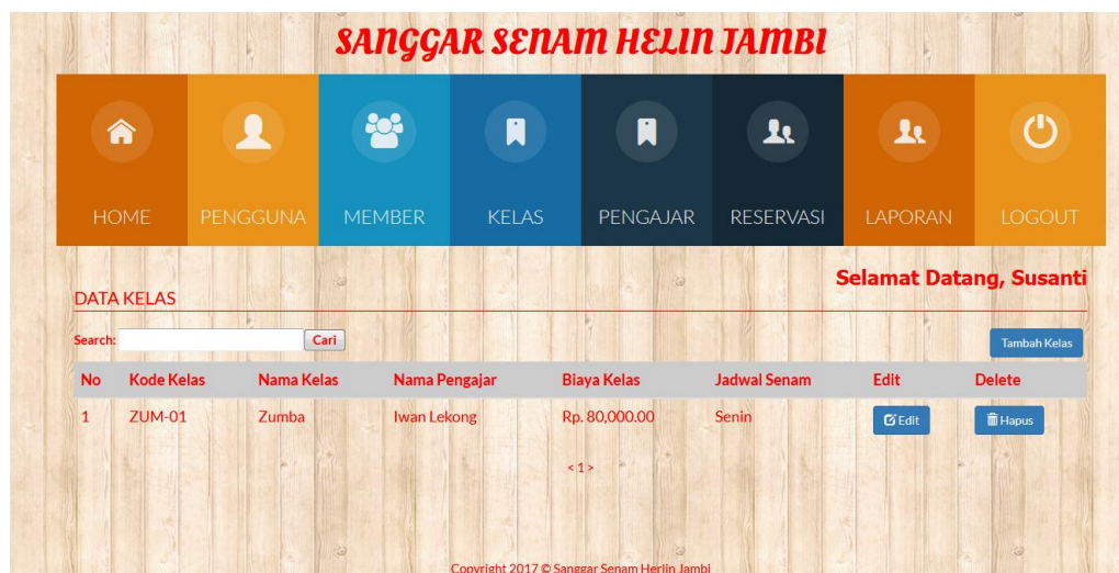
Gambar 5.5 Halaman Kelas

Halaman halaman kinerja merupakan halaman yang berisikan informasi mengenai data kelas dan terdapat link untuk mengubah atau menghapus data kelas yang diinginkan. Gambar 5.5 merupakan hasil implementasi dari rancangan pada gambar 4.30.