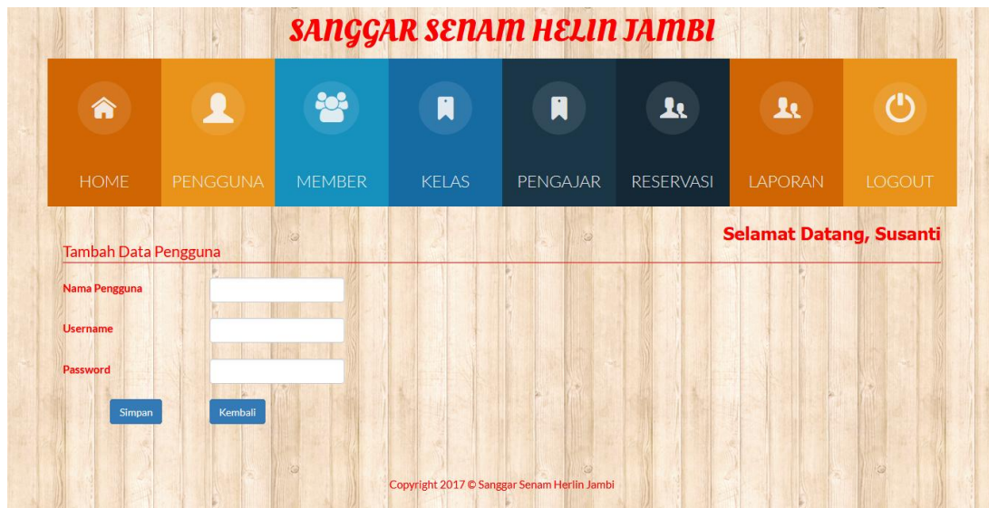
Gambar 5.11 Halaman Tambah Pengguna

Halaman tambah pengguna digunakan oleh pengguna sistem untuk menambah pengguna baru ke dalam sistem. Gambar 5.11 merupakan hasil implementasi dari rancangan pada gambar 4.36.