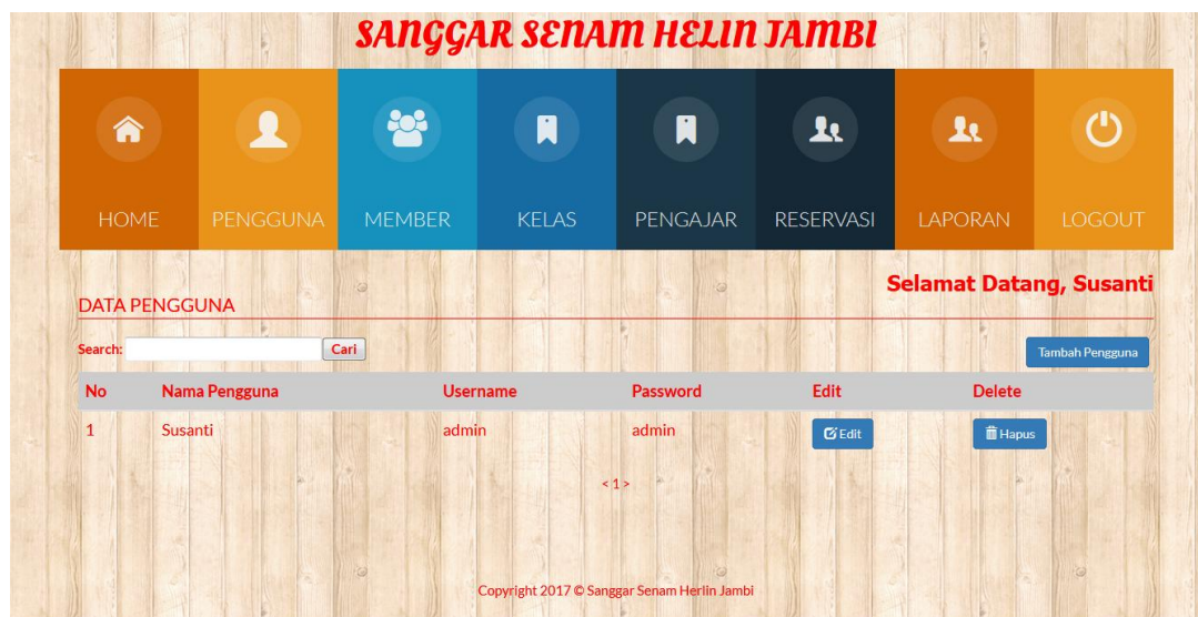
Gambar 5.2 Halaman Pengguna

Halaman pengguna merupakan halaman yang berisikan informasi mengenai data pengguna dan terdapat link untuk mengedit dan menghapus data pengguna yang diinginkan. Gambar 5.2 merupakan hasil implementasi dari rancangan pada gambar 4.27.