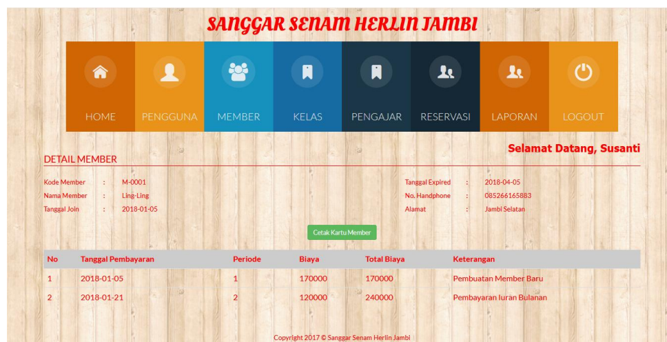
Gambar 5.4 Halaman Detail Member

Gambar 5.4 merupakan hasil implementasi dari rancangan pada gambar 4.29.