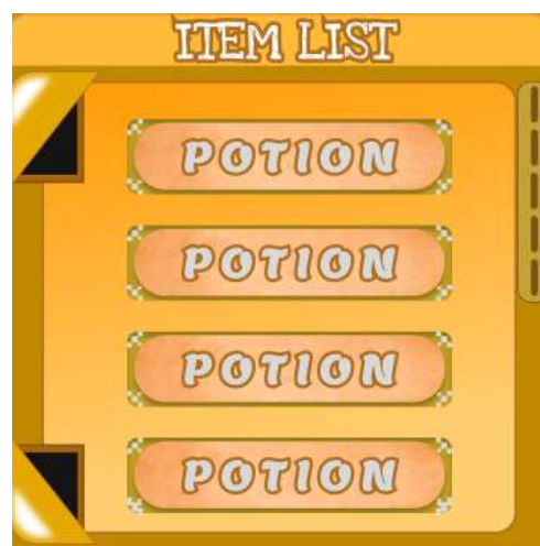
Gambar 5.12 Rancangan Halaman Main Menu

Tampilan Ini adalah tempat item list kita atau item kita di kelompokkan sesuai dengan kemampuan nya.