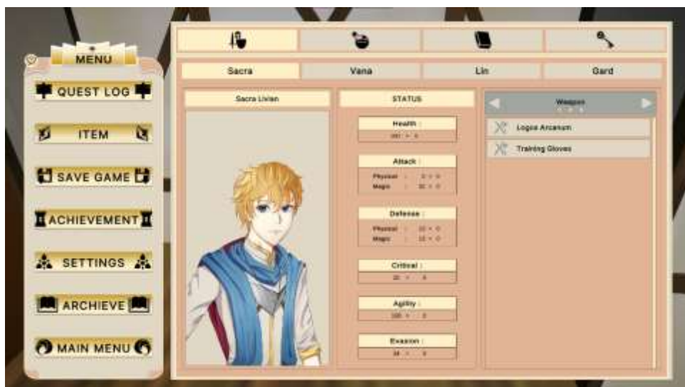
Gambar 5.4 Rancangan Halaman Main Menu

Menu Item ialah dimana tempat item yang kita dapat kan pada saat bermain game di simpan sehingga kita bisa memilih dan mau menggunakan yang mana