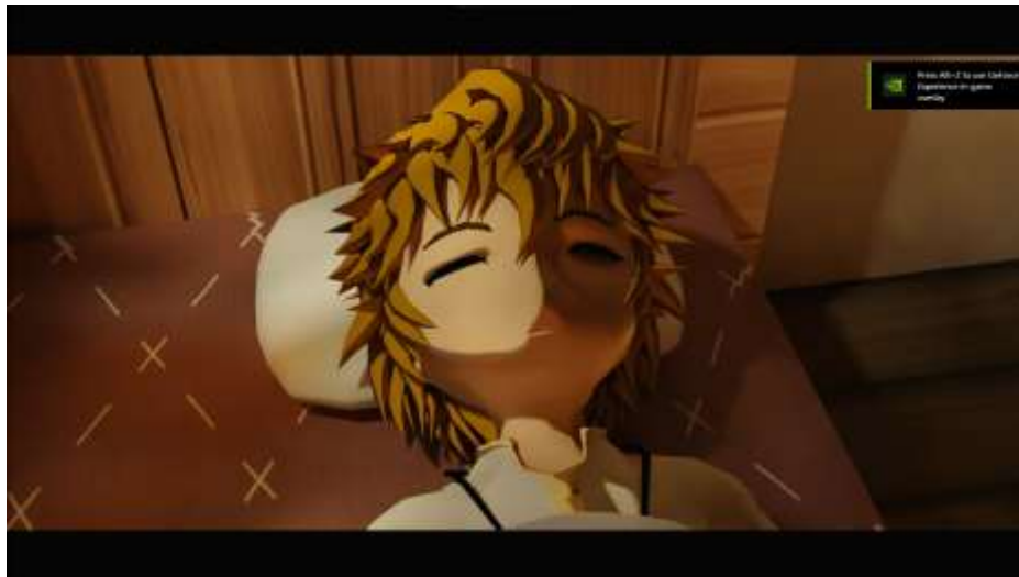
Gambar 5.6 Rancangan Halaman Main Menu