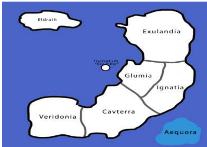
Gambar 5.5 Rancangan Halaman Main Menu

Main Map yaitu map utama dari game nivandria yaitu map keseluruhan dari game ini