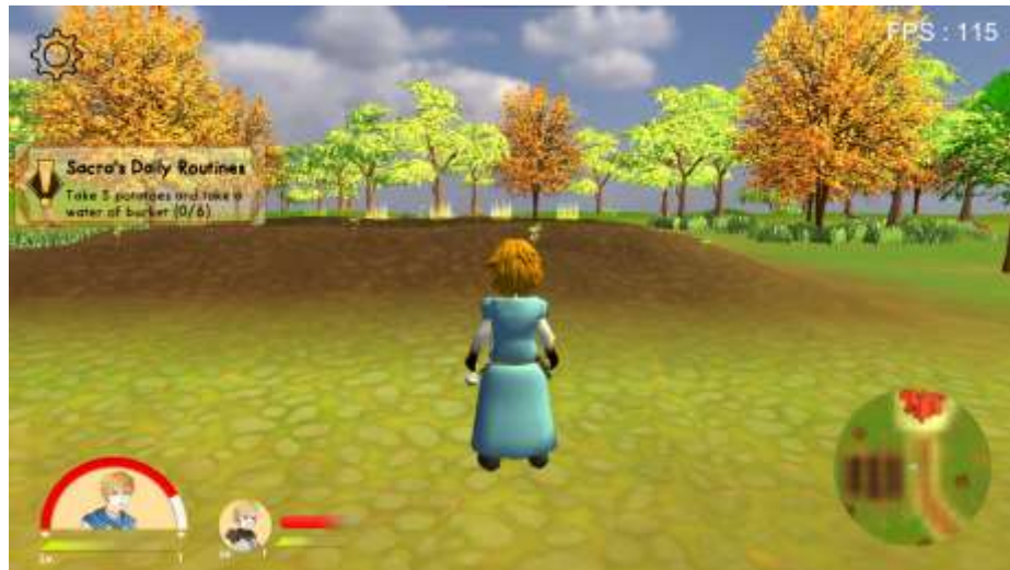
Gambar 5.9 Rancangan Halaman Main Menu