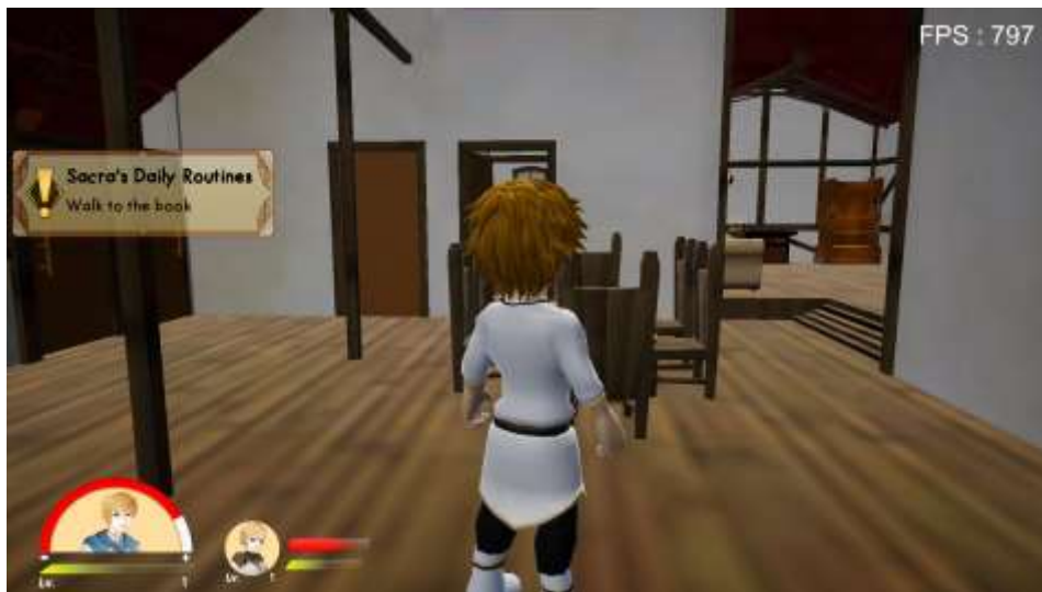
Gambar 5.7 Rancangan Halaman Main Menu

Tampilan ini yaitu dari rumah player utama yaitu sacara