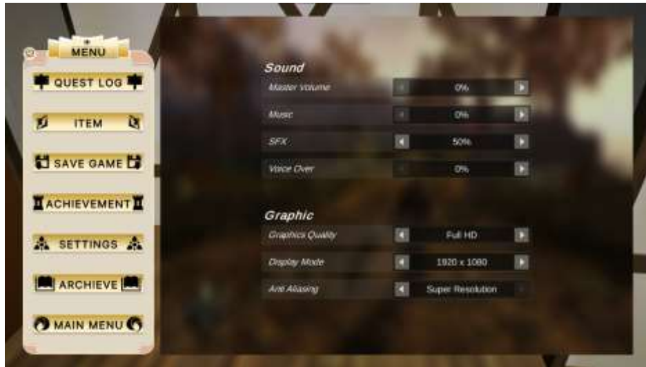
Gambar 5. 2 Rancangan Halaman Main Menu

Menu settings ialah dimana menu kita dapat merubah setingan yang kita gunakan sesuai dengan kemauan kita yang dapat merubah , sensitivitas , sfx , sound , background