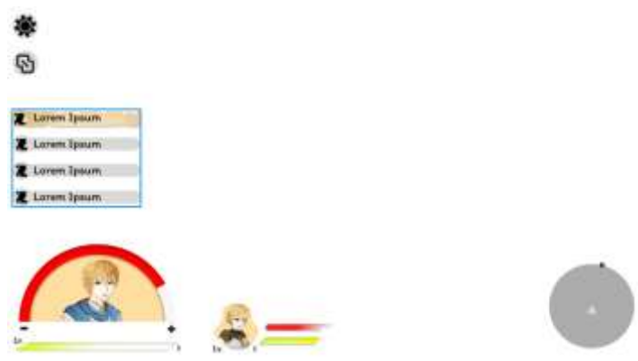
Gambar 5.10 Rancangan Halaman Main Menu

Ui Exsplorasi adalah tampilan pada saat bermain game tentang darah , skills , iteam yang di dapatkan dan juga quest.