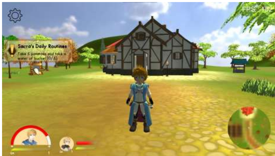
Gambar 5.8 Rancangan Halaman Main Menu

Tampilan ini adalah bagian depan rumah sacra karakter pada game ini dan di sini lah awal dari game ini di mulai