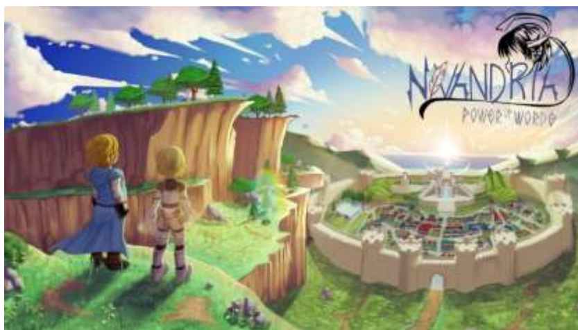
Gambar 5. 1 Rancangan Halaman Main Menu

Halaman main menu yaitu halaman utama saat kita pertama kali memulai dan bermain game Nivandria.