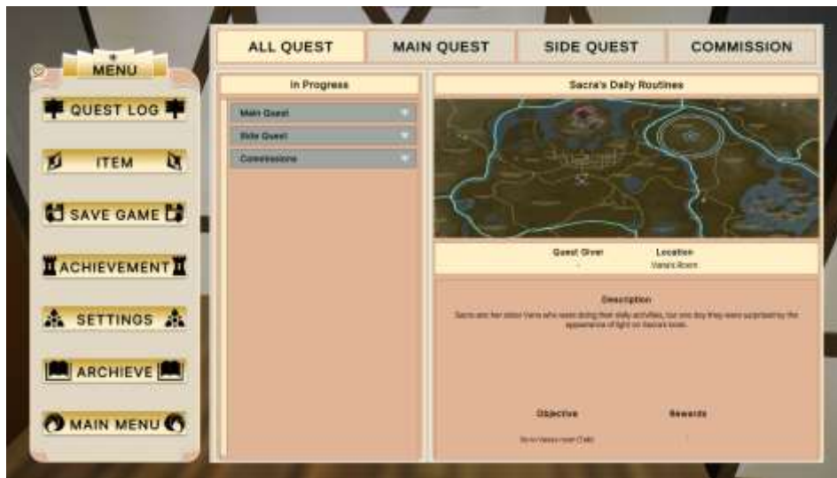
Gambar 5.3 Rancangan Halaman Main Menu