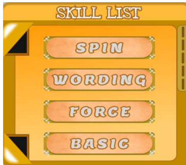
Gambar 5.13 Rancangan Halaman Main Menu.

Skill list adalah tempat dimana skill – skill kita bisa di gunakan pada saat pertempuran atau menghadapi boss