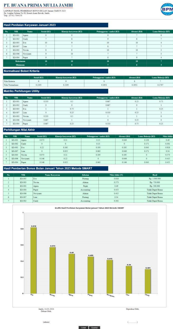
Gambar 5.13 Halaman Laporan Pemberian Bonus Metode SMART

Merupakan laporan hasil perhitungan penilaian karyawan menggunakan metode SMART dan menampilkan hasil karyawan yang layak mendapatkan bonus. Gambar 5.13 merupakan hasil implementasi dari rancangan pada gambar 4.35.