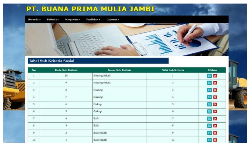
Gambar 5.9 Halaman Tabel Sub Kriteria

Merupakan halaman yang menampilkan informasi lengkap dari sub kriteria dan terdapat pengaturan untuk mengubah dan menghapus data. Gambar 5.9 merupakan hasil implementasi dari rancangan pada gambar 4.31.