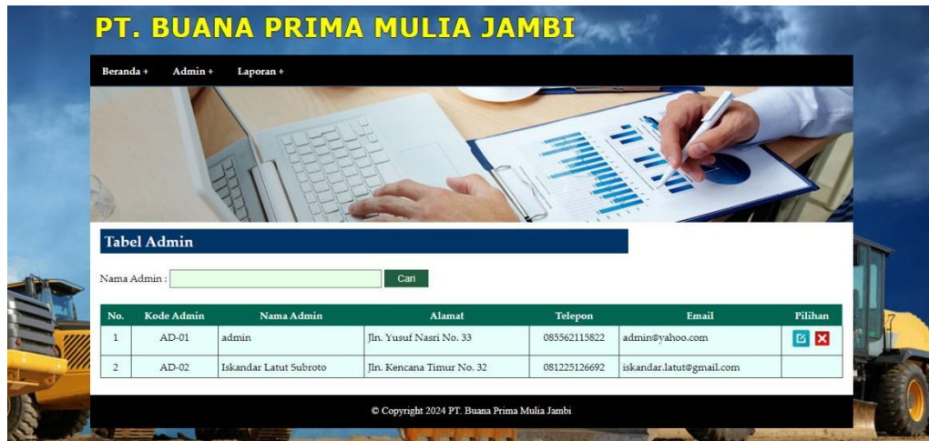
Gambar 5.14 Halaman Tabel Admin HRD

Merupakan halaman yang menampilkan data-data admin HRD dan terdapat link untuk mengubah dan menghapus data tersebut. Gambar 5.14 merupakan hasil implementasi dari rancangan pada gambar 4.36.