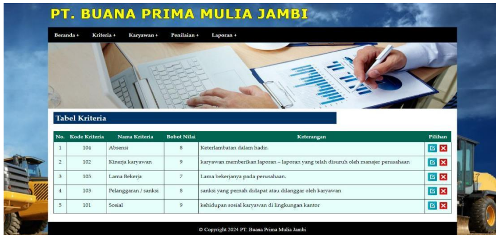
Gambar 5.8 Halaman Tabel Kriteria

Merupakan halaman yang menampilkan informasi lengkap dari kriteria dan terdapat pengaturan untuk mengubah dan menghapus data. Gambar 5.8 merupakan hasil implementasi dari rancangan pada gambar 4.30.