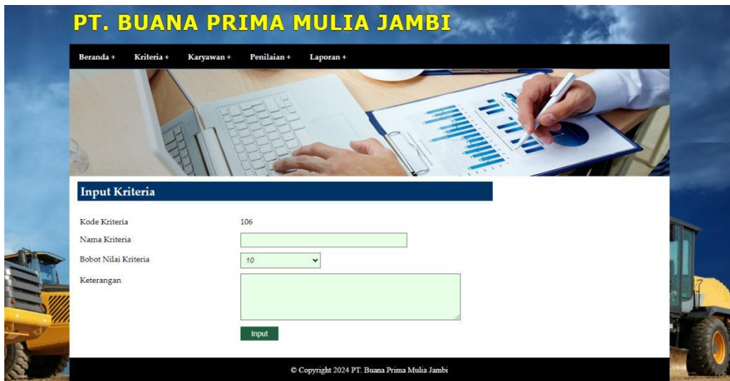
Gambar 5.3 Halaman Input Kriteria