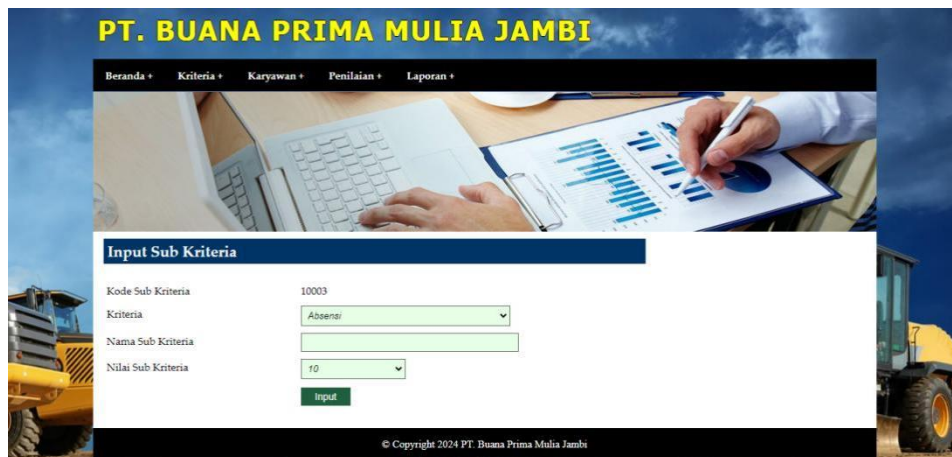
Gambar 5.4 Halaman Input Sub Kriteria

Merupakan halaman yang menampilkan form untuk menambah data sub kriteria baru dengan kolom yang terdiri dari kriteria, nama sub kriteria, dan nilai sub kriteria. Gambar 5.4 merupakan hasil implementasi dari rancangan pada gambar 4.26.