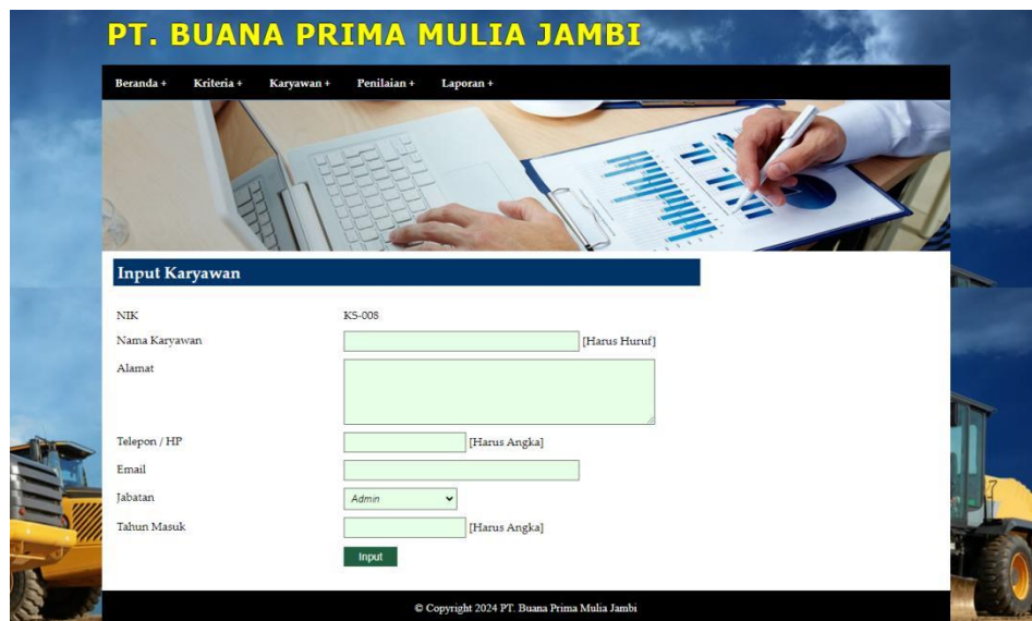
Gambar 5.2 Halaman Input Karyawan

Merupakan halaman yang menampilkan form untuk menambah data karyawan baru dengan kolom yang terdiri dari nama karyawan, alamat, telepon / hp, email, jabatan dan tahun masuk. Gambar 5.2 merupakan hasil implementasi dari rancangan pada gambar 4.24.