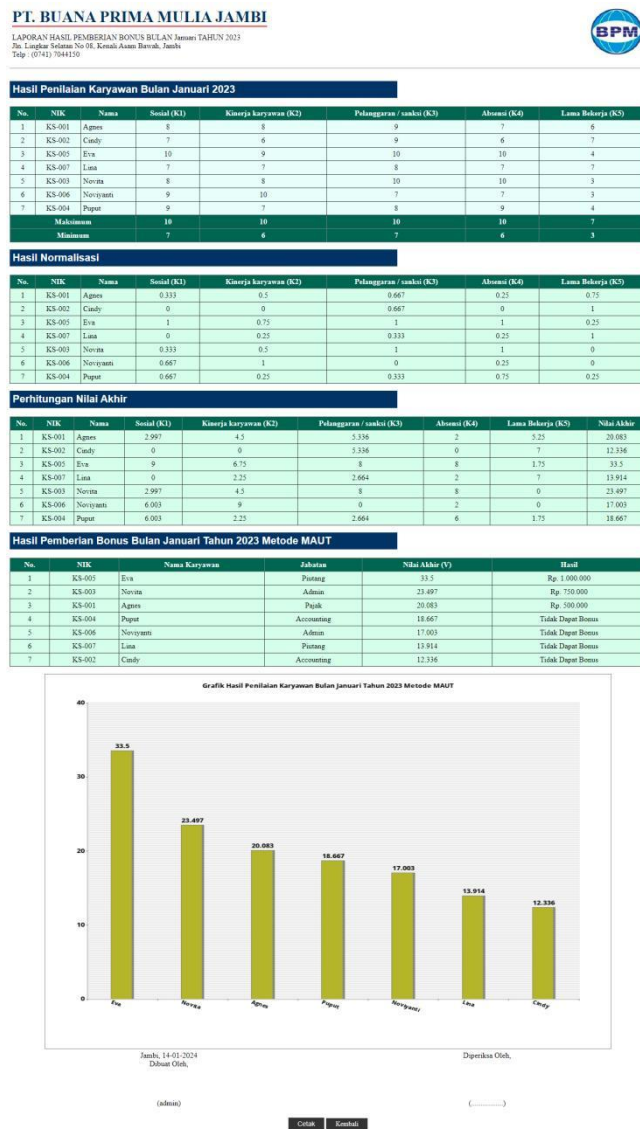
Gambar 5.12 Halaman Laporan Pemberian Bonus Metode MAUT

Merupakan laporan hasil perhitungan penilaian karyawan menggunakan metode MAUT dan menampilkan hasil karyawan yang layak mendapatkan bonus. Gambar 5.12 merupakan hasil implementasi dari rancangan pada gambar 4.34.