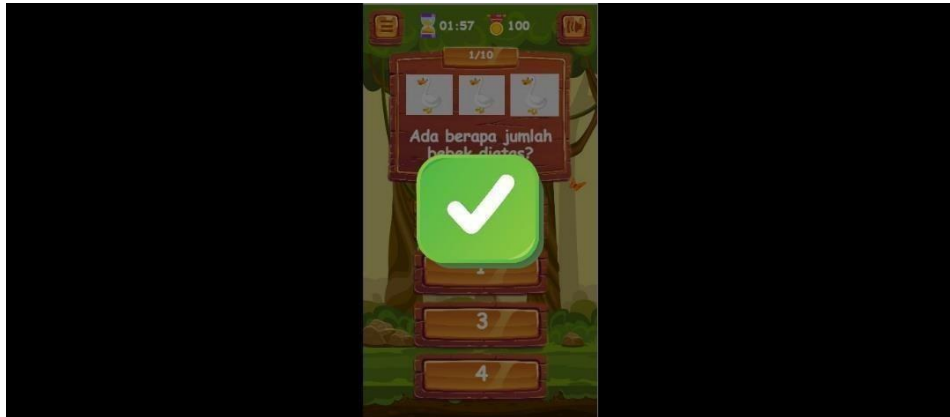
Gambar 5.4 Tampilan Halaman Jawaban Benar

Pada tampilan ini user akan melihat jawabannya benar, jika jawaban user benar akan muncul simbol ✓ berwarna hijau. Gambar 5.4 merupakan implementasi dari rancangan pada gambar 4.8.