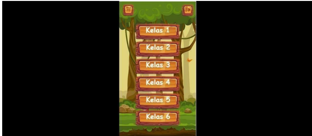
Gambar 5.2 Tampilan Halaman Menu Pemilihan Kelas

Pada rancangan ini user akan melihat tampilan saat akan memilih kelas dan untuk memulai permainan user akan menekan tombol mulai. Gambar 5.2 merupakan implementasi dari rancangan pada gambar 4.6.