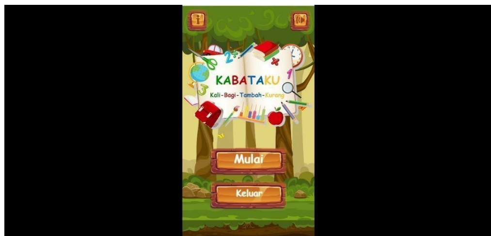
Gambar 5.1 Tampilan Halaman Menu Utama

Pada rancangan menu utama ini user akan melihat tampilan awal dari aplikasi dan dapat memilih dari 2 tombol yang tersedia (Mulai, Keluar) masing-masing tombol memiliki beberapa fungsi yaitu tombol mulai untuk memulai permainan dan keluar berfungsi untuk keluar dari permainan. Gambar 5.1 merupakan implemntasi dari rancangan pada gambar 4.5