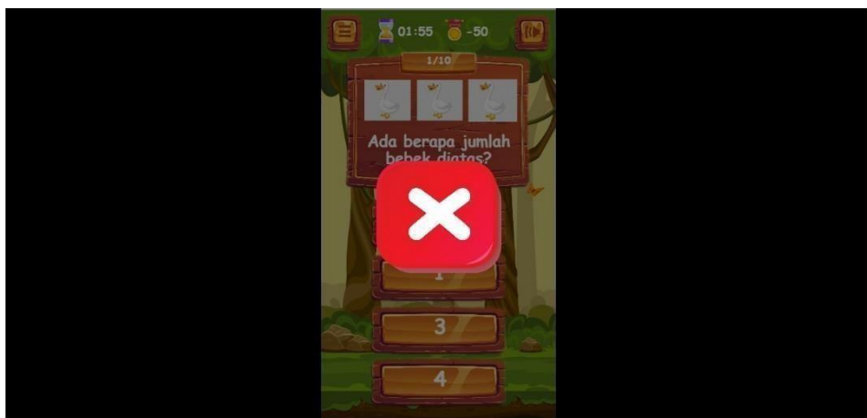
Gambar 5.5 Tampilan Halaman Jawaban Salah

Pada tampilan ini user akan melihat jawabannya salah, jika jawaban user salah akan muncul simbol X berwarna merah. Gambar 5.5 merupakan implementasi dari rancangan pada gambar 4.9.