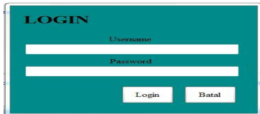
Gambar 5.1 Tampilan Halaman Login

Halaman ini adalah halaman di mana admin dapat memasuki sistem dengan mengisi username dan password , kemudian klik login setelah itu admin dapat melakukan pengelolaan sistem. Tampilan halaman login adalah seperti gambar 5.1 berikut ini: