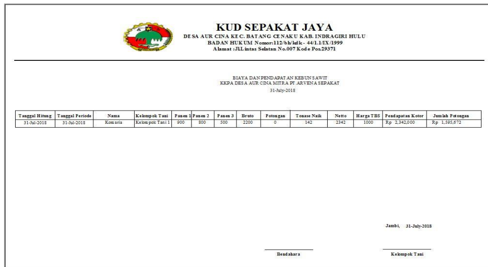
Gambar 5.12 Tampilan Laporan Data Pembayaran Gaji