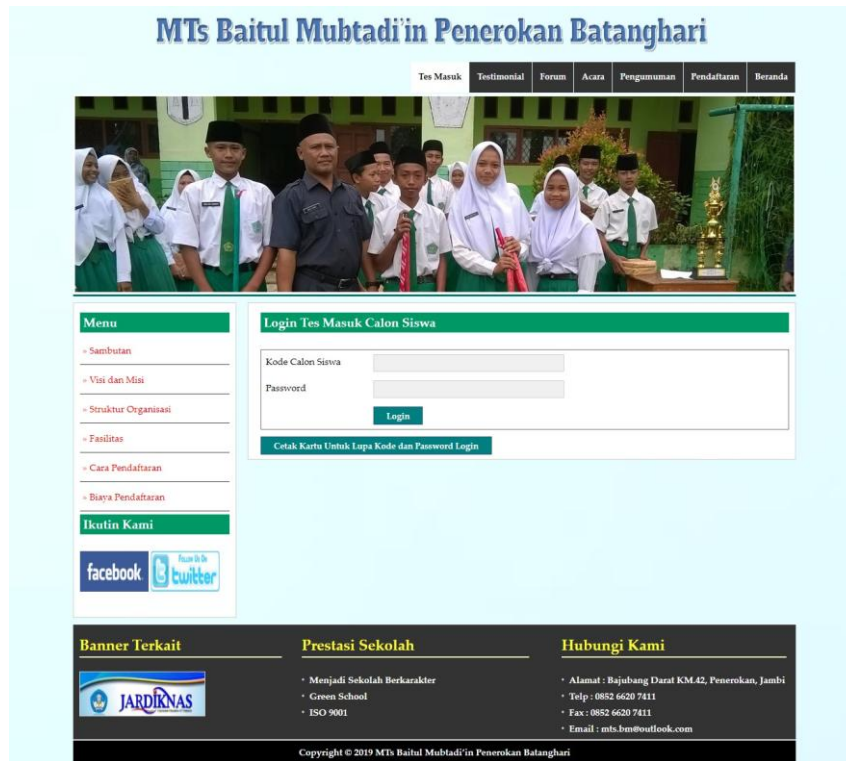
Gambar 5.15 Login Tes Masuk