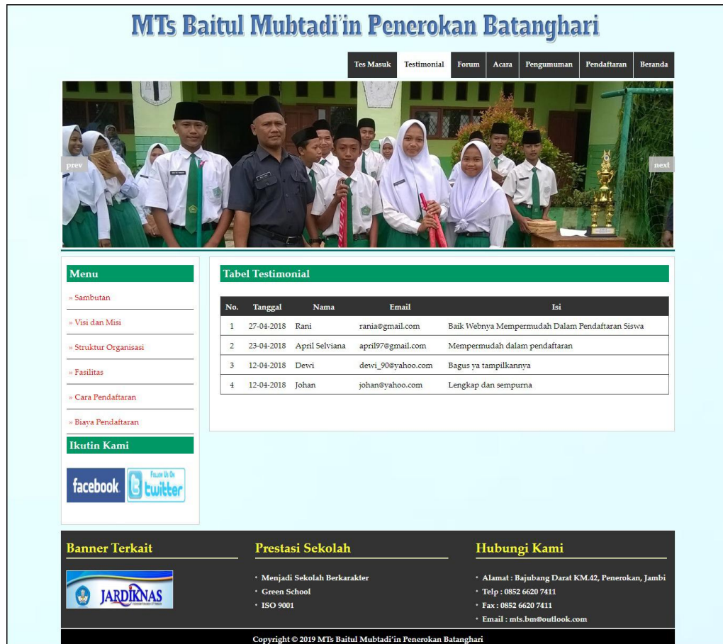
Gambar 5.8 Tabel Testimonial