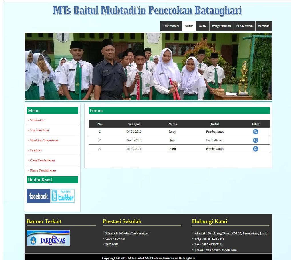
Gambar 5.9 Tabel Forum