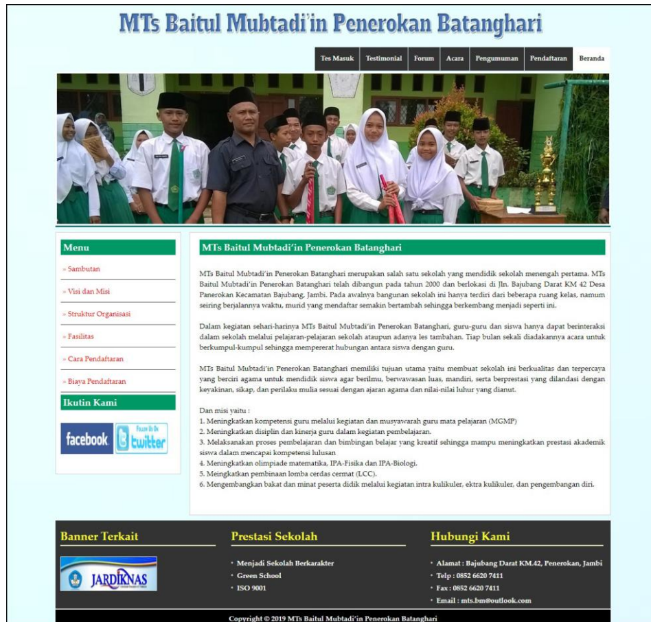
Gambar 5.7 Beranda