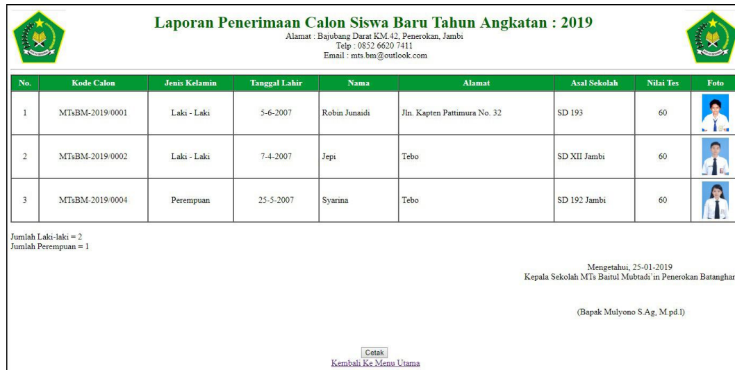
Gambar 5.6 Laporan Penerimaan Siswa Baru