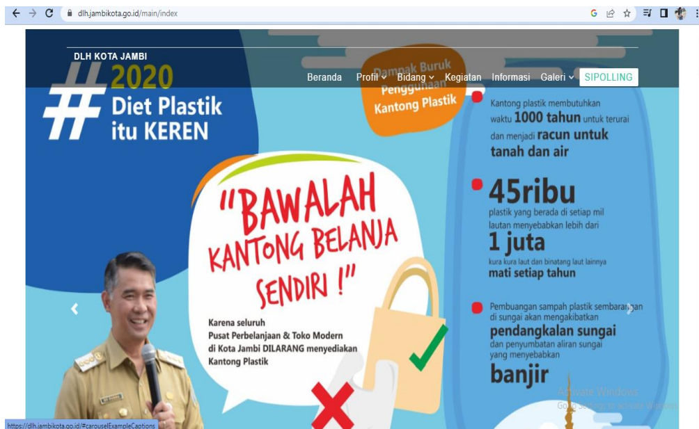
Gambar 4.1 Halaman Website DLH Kota Jambi