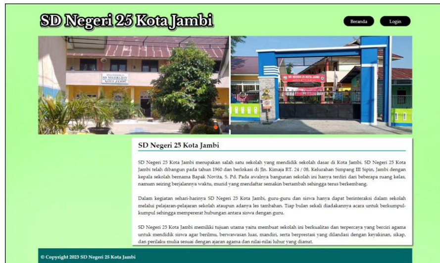
Gambar 5.1 Tampilan Halaman Beranda