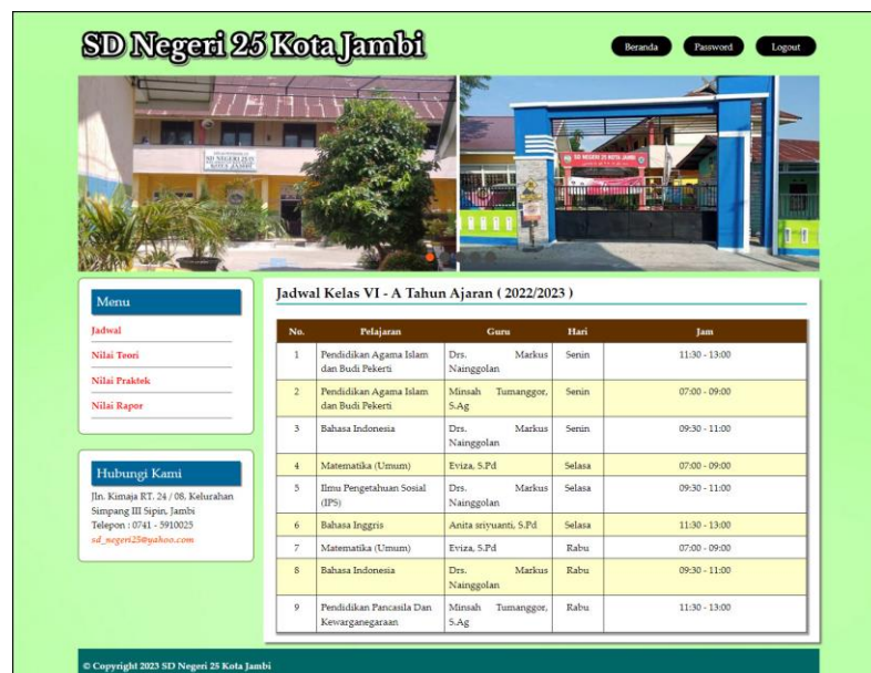
Gambar 5.2 Tampilan Halaman Informasi Jadwal

Tampilan halaman informasi jadwal merupakan halaman yang digunakan oleh guru untuk melihat jadwal pelajaran atau jadwal mengajar dimana terdapat informasi mengenai pelajaran, guru, hari dan jam. Gambar 5.2 merupakan hasil implementasi dari rancangan output informasi jadwal pada gambar 4.31.