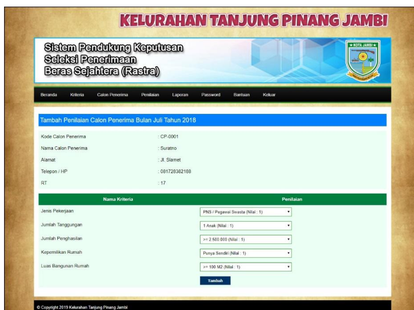
Gambar 5.5 Tambah Penilaian

Halaman tambah penilaian menampilkan form yang berisikan field penilaian calon penerima berdasarkan kriteria yang diisi untuk menambah data penilaian yang baru. Gambar 5.5 tambah penilaian merupakan hasil implementasi dari rancangan pada Gambar 4.27.