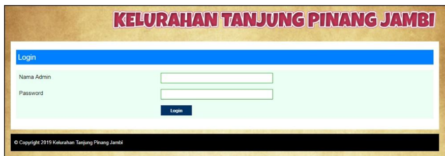
Gambar 5.1 Login

Halaman login menampilkan form yang berisikan field nama admin dan password yang diisi untuk dapat masuk ke halaman utama. Gambar 5.1 login merupakan hasil implementasi dari rancangan pada Gambar 4.23.