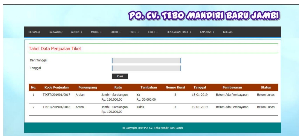
Gambar 5.14 Tabel Data Penjualan Tiket

Halaman tabel data penjualan tiket merupakan halaman yang menampilkan informasi mengenai data penjualan tiket yang telah ditambahkan dengan terdapat kode penjualan, penumpang, rute, nomor kursi, tanggal, pembayaran dan status. Gambar 5.14 tabel data penjualan tiket merupakan hasil implementasi dari rancangan pada gambar 4.41.