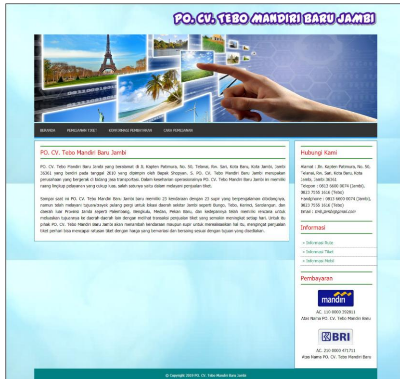
Gambar 5.16 Beranda Pengunjung