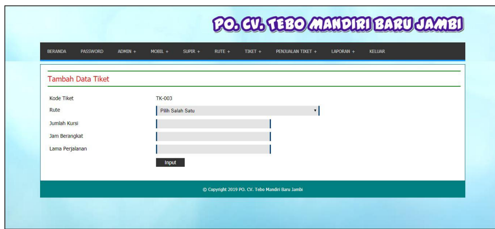
Gambar 5.5 Tambah Data Tiket

Halaman tambah data tiket merupakan halaman yang digunakan untuk menambah data tiket dengan mengisi rute, jumlah kursi, jam berangkat, dan lama perjalanan. Gambar 5.5 tambah data tiket merupakan hasil implementasi dari rancangan pada gambar 4.32.