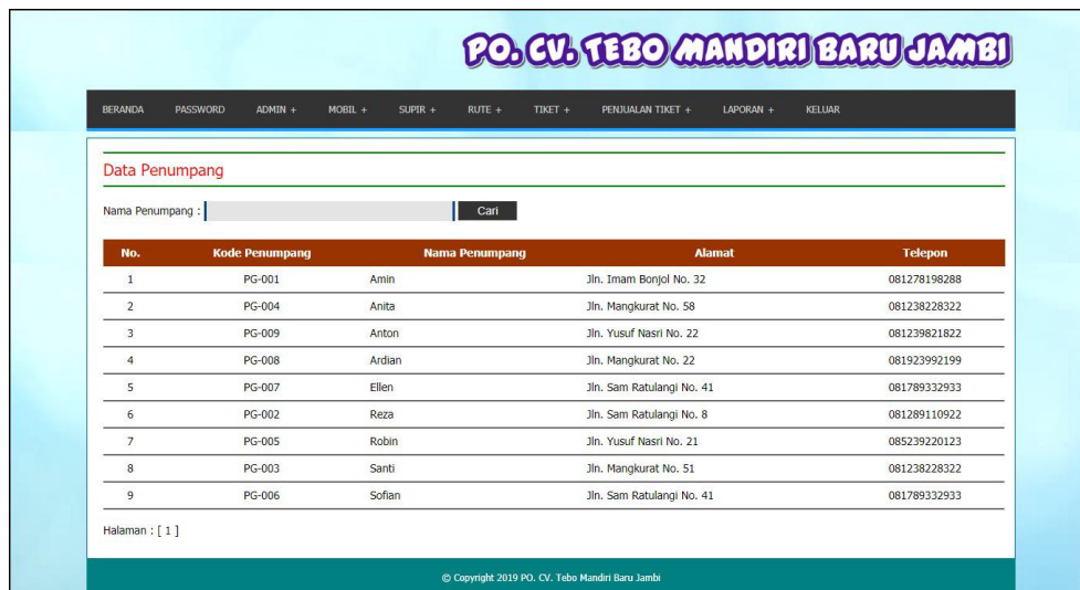
Gambar 5.13 Tabel Data Penumpang