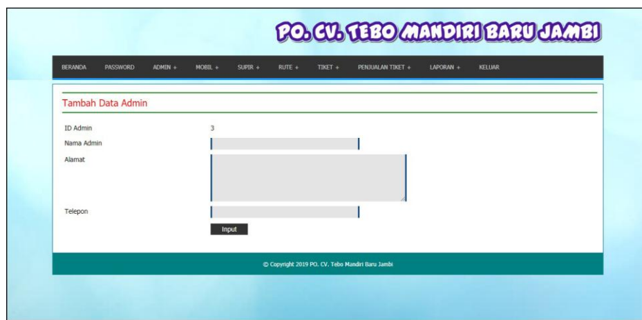
Gambar 5.2 Tambah Data Admin

Halaman tambah data admin merupakan halaman yang digunakan untuk menambah data admin dengan mengisi nama admin, alamat dan telepon. Gambar 5.2 tambah data admin merupakan hasil implementasi dari rancangan pada gambar 4.29.