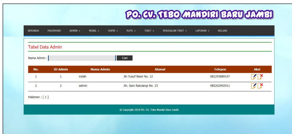
Gambar 5.9 Tabel Admin

Halaman tabel admin merupakan halaman yang menampilkan informasi mengenai data admin yang telah ditambahkan dengan terdapat no, id admin, nama admin, alamat, telepon dan aksi untuk mengubah dan menghapus data. Gambar 5.9 tabel admin merupakan hasil implementasi dari rancangan pada gambar 4.36.