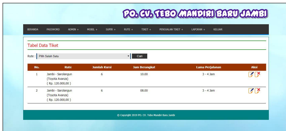
Gambar 5.12 Tabel Data Tiket

Halaman tabel data tiket merupakan halaman yang menampilkan informasi mengenai data tiket yang telah ditambahkan dengan terdapat no, rute, jumlah kursi, jam berangkat, lama perjalanan dan aksi untuk mengubah dan menghapus data. Gambar 5.12 tabel data tiket merupakan hasil implementasi dari rancangan pada gambar 4.39.