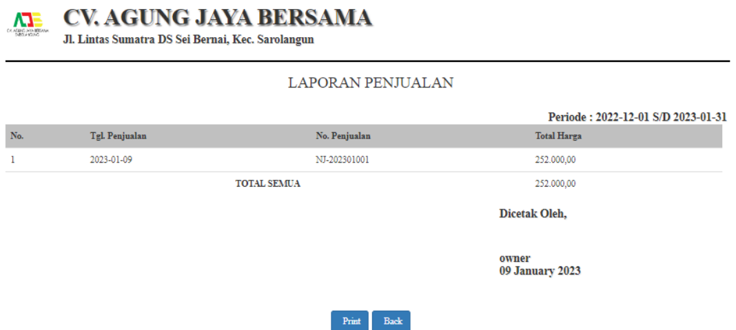
Gambar 5.12 Halaman Laporan Penjualan

Halaman laporan penjualan berisikan informasi mengenai data penjualan barang di CV.Agung Jaya Bersama dan terdapat button untuk mencetak dan kembali. Gambar 5.12 hasil implementasi dari rancangan output pada gambar 4.46.