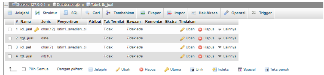
Gambar 5.34 Tabel Penjualan

Gambar 5.34 tabel pengguna merupakan hasil implementasi dari rancangan tabel penjualan pada gambar 4.23.