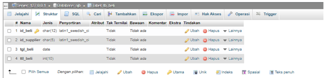
Gambar 5.35 Tabel Pembelian