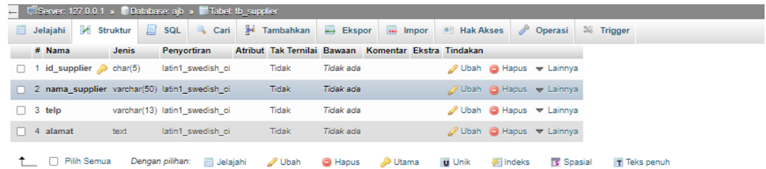
Gambar 5.33 Halaman Tabel Supplier

Gambar 5.33 tabel pengguna merupakan hasil implementasi dari rancangan tabel supplier pada tabel 4.20.