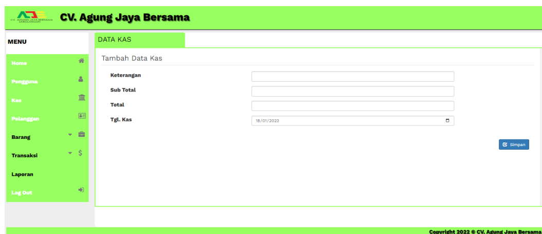
Gambar 5.19 Halaman Tambah Kas

Halaman tambah kas merupakan rancangan yang digunakan oleh karyawan ataupun pemilik untuk menambah data kas. Gambar 5.19 hasil implementasi dari rancangan input pada gambar 4.52.