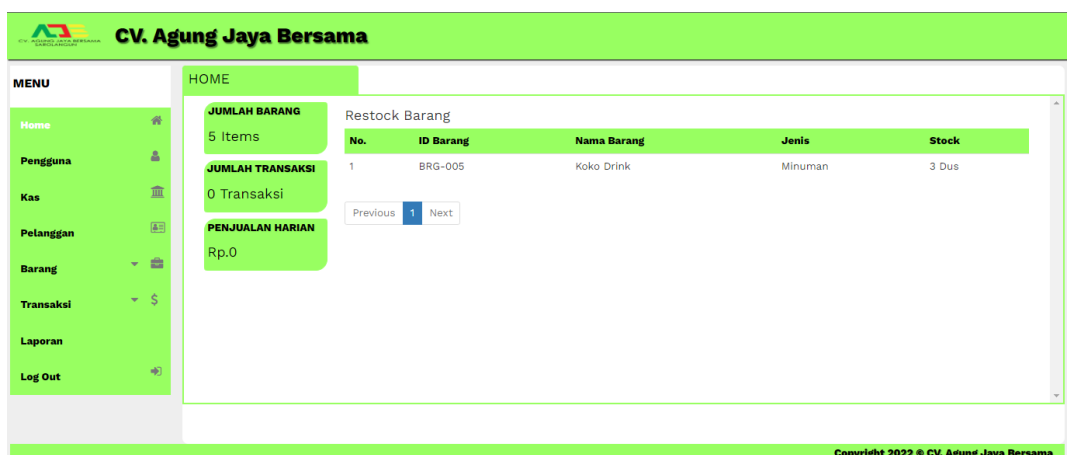
Gambar 5.1 Halaman Home

Halaman home ini merupakan rancangan yang menampilkan menu-menu untuk menampilkan halaman lainnya. Gambar 5.1 hasil implementasi dari rancangan output pada gambar 4.35.