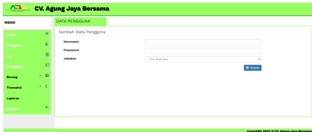
Gambar 5.18 Halaman Tambah Pengguna