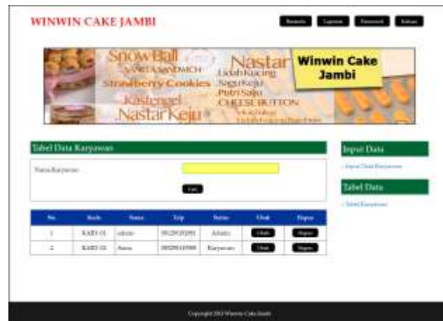
Gambar 5.10 Tabel Karyawan