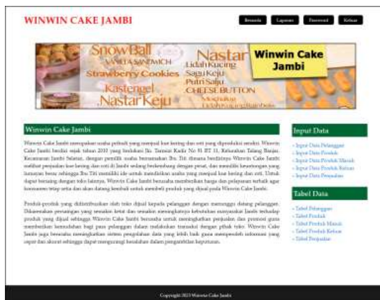
Gambar 5.9 Beranda

Halaman beranda merupakan halaman yang menampilkan informasi mengenai gambaran umum dari Winwin Cake Jambi dan menu-menu atau link yang menghubungkan dari satu halaman ke halaman lainnya. Gambar 5.9 merupakan hasil implementasi dari rancangan pada gambar 4.35.