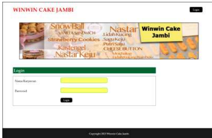
Gambar 5.1 Login