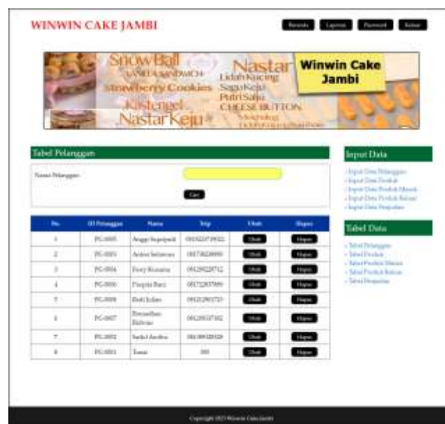
Gambar 5.11 Tabel Pelanggan

Halaman tabel pelanggan merupakan halaman yang menampilkan informasi mengenai nama, alamat, telepon, dan email dari pelanggan serta ada link yang membantu dalam mengubah dan menghapus data pelanggan dari dalam sistem. Gambar 5.11 merupakan hasil implementasi dari rancangan pada gambar 4.37.