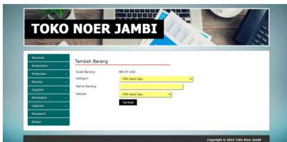
Gambar 5.13 Halaman Tambah Barang

Halaman tambah barang merupakan halaman yang digunakan untuk menambah data barang dengan mengisi data pada kolom yang tersedia dengan mengisi kategori, nama barang, dan satuan. Gambar 5.13 tambah barang merupakan hasil implementasi dari rancangan pada gambar 4.43.