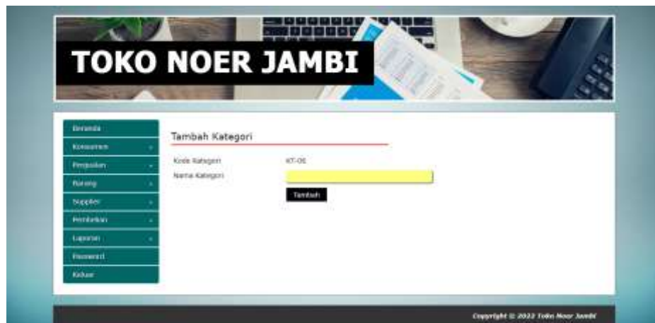
Gambar 5.12 Halaman Tambah Kategori