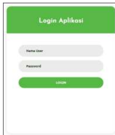
Gambar 5.8 Halaman Login

Gambar 5.8 login merupakan hasil implementasi dari rancangan pada gambar 4.38.