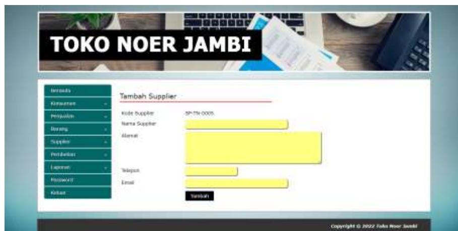
Gambar 5.11 Halaman Tambah Supplier

Halaman tambah supplier merupakan halaman yang digunakan untuk menambah data supplier dengan mengisi data pada kolom yang tersedia dengan mengisi nama supplier, alamat, telepon dan email. Gambar 5.11 tambah supplier merupakan hasil implementasi dari rancangan pada gambar 4.41.