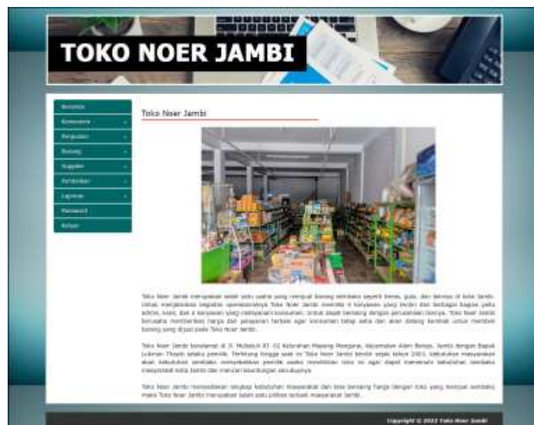
Gambar 5.1 Halaman Beranda

Halaman beranda merupakan halaman pertama diakses melakukan login dimana halaman ini menampilkan gambaran umum dari toko dan terdapat menu-menu untuk menampilkan halaman lainnya. Gambar 5.1 beranda merupakan hasil implementasi dari rancangan pada gambar 4.31