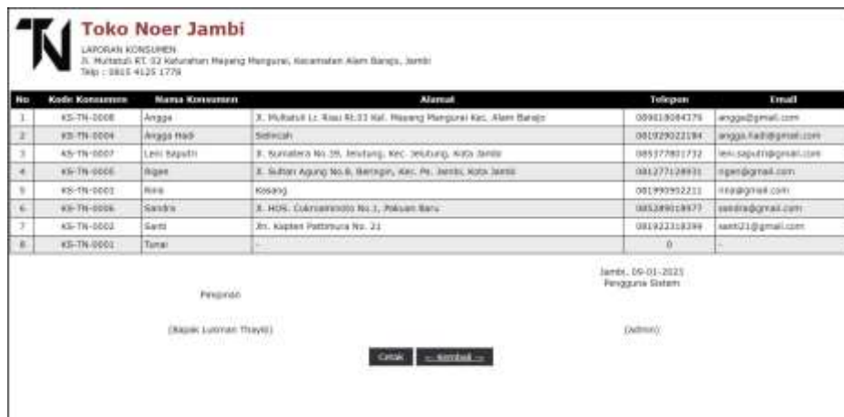
Gambar 5.3 Halaman Laporan Konsumen