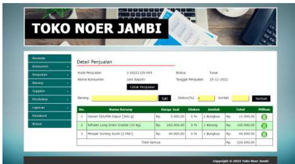
Gambar 5.17 Halaman Detail Penjualan

Halaman detail penjualan merupakan halaman yang digunakan untuk menambah data detail dengan mengisi data pada kolom yang tersedia dengan mengisi barang, diskon (%), jumlah dan terdapat informasi mengenai penjualan. Gambar 5.17 detail penjualan merupakan hasil implementasi dari rancangan pada gambar 4.47.