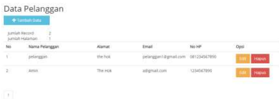
Gambar 5.9 Tampilan Menu Data User

Tampilan halaman Menu data user pada Gambar 5.9 merupakan implementasi dari rancangan halaman data user yang berfungsi menambah user, edit user dan update user oleh admin pada Gambar 4.24, sedangkan listing coding program terdapat pada lampiran.