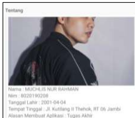
Gambar 5.8 Tampilan Halaman Menu Tentang