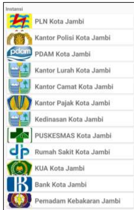
Gambar 5.3 Tampilan Halaman Menu kantor