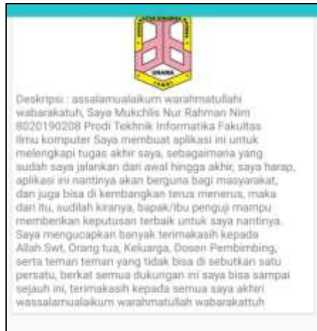
Gambar 5.7 Tampilan Halaman Menu Info