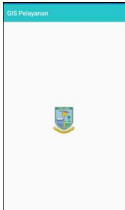
Gambar 5.1 Tampilan Halaman Pembuka