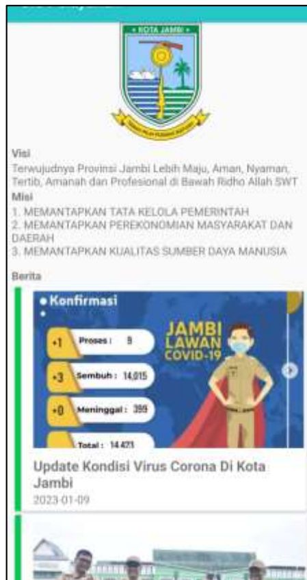
Gambar 5.2 Tampilan Halaman Menu Utama