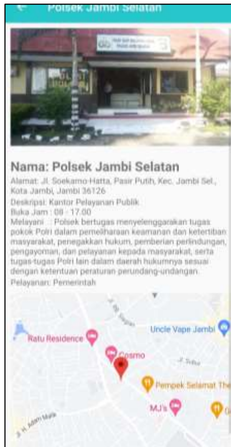
Gambar 5.5 Tampilan Halaman Menu Kantor Pelayanan