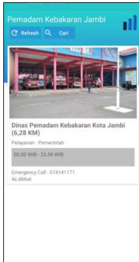
Gambar 5.4 Tampilan Halaman Menu Kantor Pelayanan Pemerintah