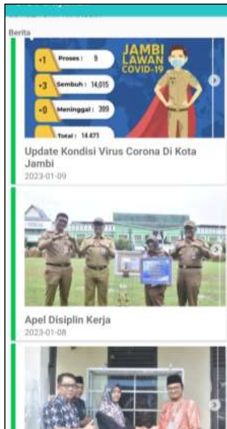
Gambar 5.6 Tampilan Halaman Menu Berita