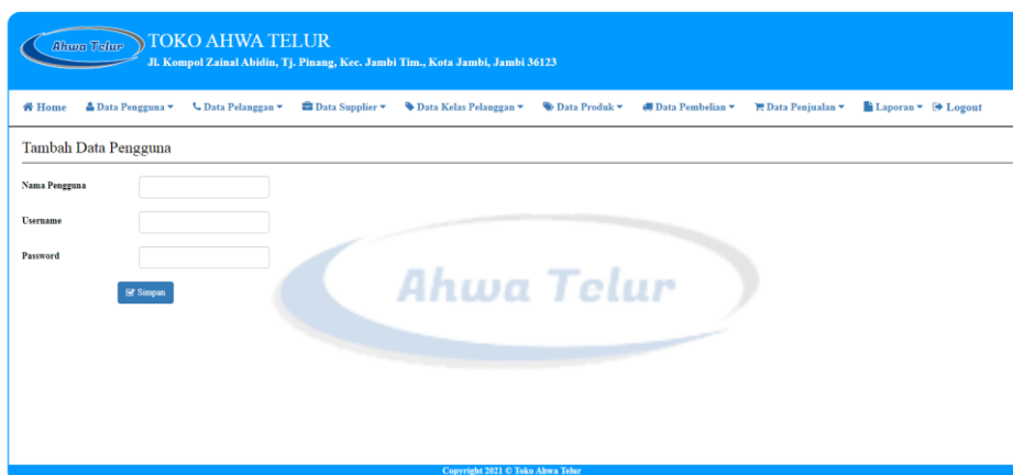
Gambar 5.13 Halaman Tambah Pengguna

Halaman tambah pengguna ini adalah halaman utama untuk pencatatan data pengguna. Pada halaman ini ditampilkan form tambah pengguna yang berfungsi untuk melakukan pencatatan data-data pengguna.