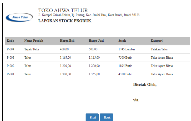
Gambar 5.11 Halaman Laporan Stock Produk

Halaman laporan stock produk ini adalah halaman utama untuk penyajian laporan stock produk. Tampilan halaman laporan stock produk berisikan informasi mengenai data laporan stock produk.