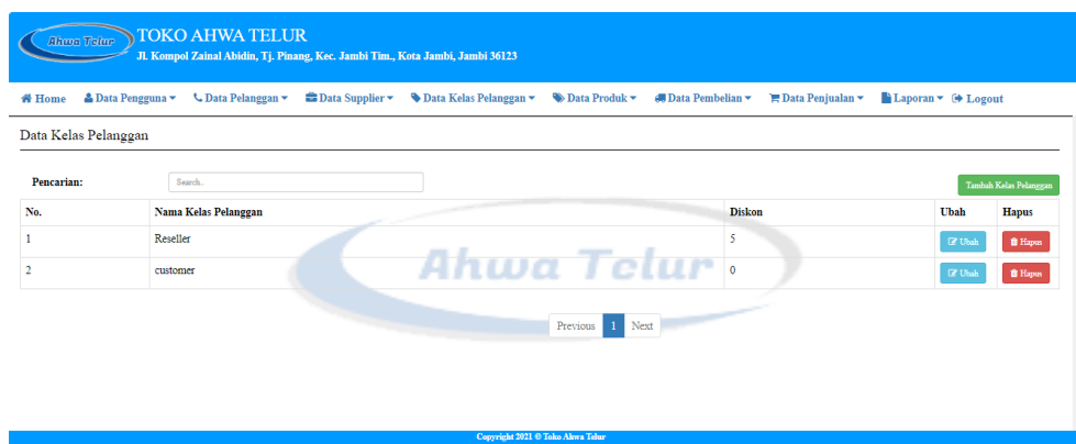
Gambar 5.5 Halaman Kelas Pelanggan

Halaman kelas pelanggan ini adalah halaman utama untuk penyajian data-data kelas pelanggan yang sudah diinput sebelumnya. Tampilan halaman kelas pelanggan berisikan informasi mengenai data kelas pelanggan yang dapat menggunakan sistem dan terdapat link untuk mengubah data kelas pelanggan yang diinginkan.