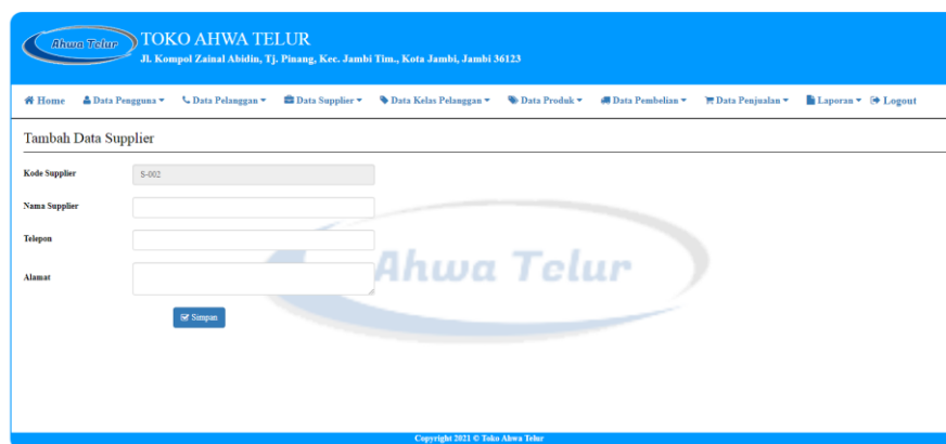
Gambar 5.15 Halaman Tambah Supplier

Halaman tambah supplier ini adalah halaman utama untuk pencatatan data supplier. Pada halaman ini ditampilkan form tambah supplier yang berfungsi untuk melakukan pencatatan data-data supplier.