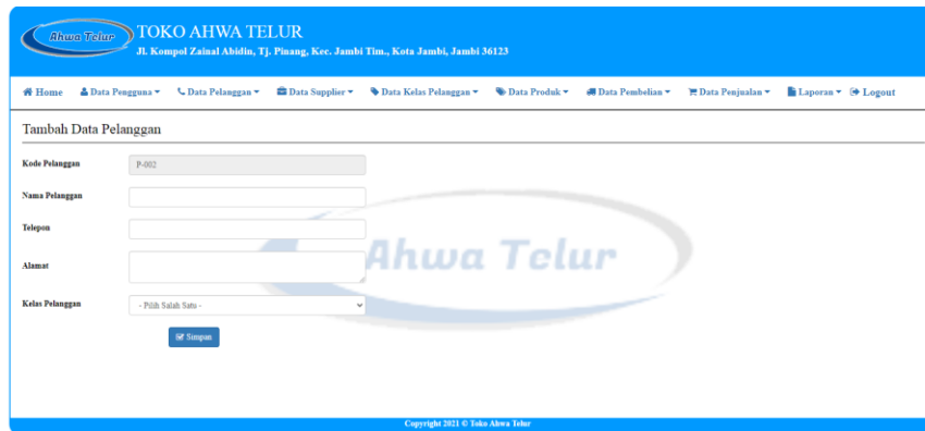
Gambar 5.14 Halaman Tambah Pelanggan

Halaman tambah pelanggan ini adalah halaman utama untuk pencatatan data pelanggan. Pada halaman ini ditampilkan form tambah pelanggan yang berfungsi untuk melakukan pencatatan data-data pelanggan.