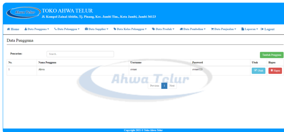
Gambar 5.2 Halaman Pengguna

Halaman pengguna ini adalah halaman utama untuk penyajian data-data pengguna yang sudah diinput sebelumnya. Tampilan halaman pengguna berisikan informasi mengenai data pengguna yang dapat menggunakan sistem dan terdapat link untuk mengubah data pengguna yang diinginkan.