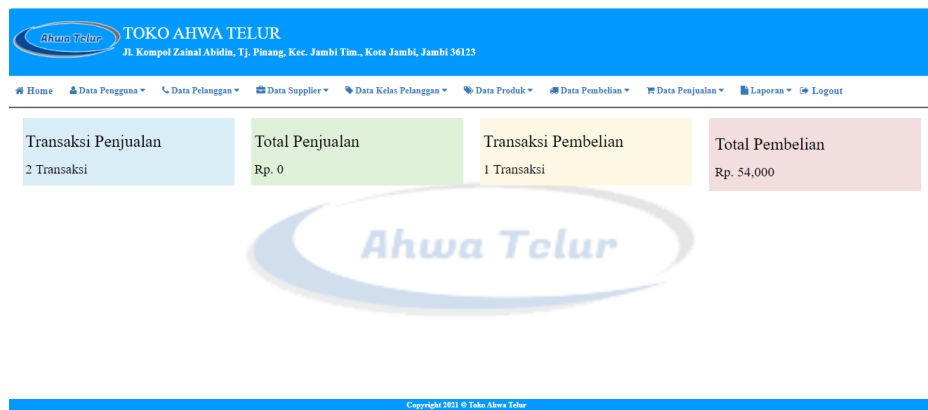
Gambar 5.1 Halaman Home