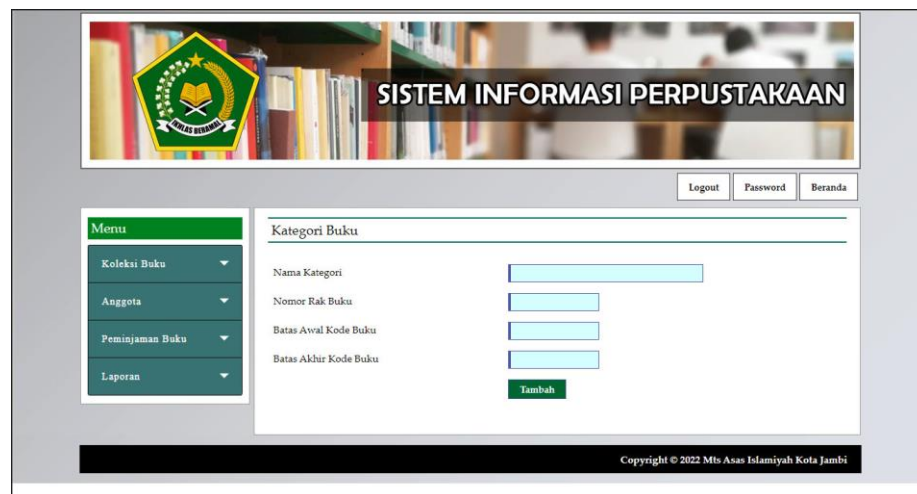
Gambar 5.13 Halaman Tambah Kategori Buku

Halaman tambah kategori buku merupakan halaman yang menampilkan kolom-kolom yang dapat di input untuk menambah data kategori buku pada sistem. Gambar 5.13 merupakan hasil implementasi dari rancangan tambah kategori buku pada gambar 4.40.