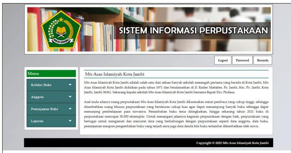
Gambar 5.1 Halaman Beranda

Halaman beranda merupakan halaman yang menampilkan informasi mengenai Mts Asas Islamiyah Kota Jambi dan terdapat menu-menu yang menghubungkan ke halaman lainnya. Gambar 5.1 merupakan hasil implementasi dari rancangan tabel pengunjung pada gambar 4.28.