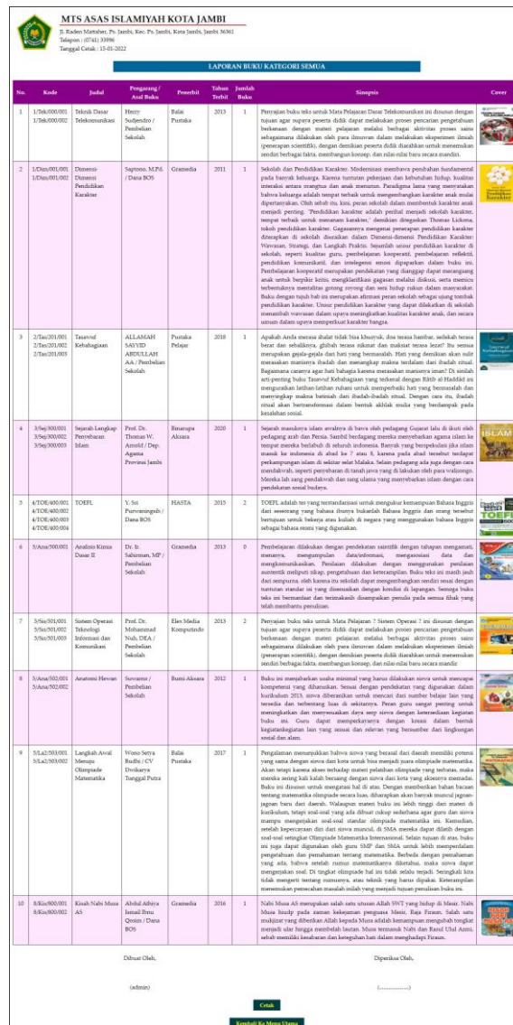
Gambar 5.9 Halaman Laporan Buku