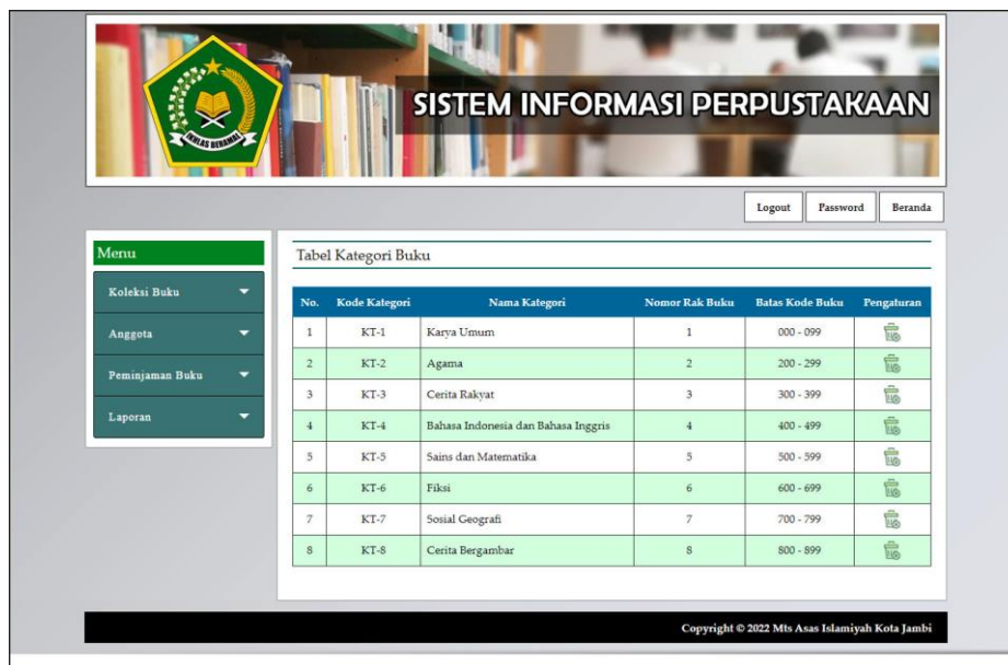
Gambar 5.2 Halaman Tabel Kategori Buku

Halaman tabel kategori buku merupakan halaman yang menampilkan informasi mengenai no, nama kategori, nomor rak buku, batas kode buku dan pengaturan untuk menghapus data. Gambar 5.2 merupakan hasil implementasi dari rancangan tabel kategori buku pada gambar 4.29.