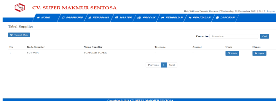
Gambar 5.3 Tampilan Halaman Tabel Supplier

Halaman tabel supplier merupakan tampilan form yang digunakan untuk melihat data-data supplier. Dalam form ini dapat dilakukan tambah data supplier, edit data supplier, dan hapus data supplier. Dibawah ini merupakan tampilan tabel supplier :