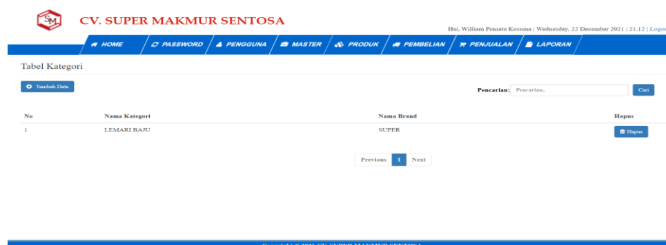
Gambar 5.5 Tampilan Halaman Tabel Kategori

Halaman tabel kategori merupakan tampilan form yang digunakan untuk melihat data-data kategori. Dalam form ini dapat dilakukan tambah data kategori dan hapus data kategori. Dibawah ini merupakan tampilan tabel kategori: