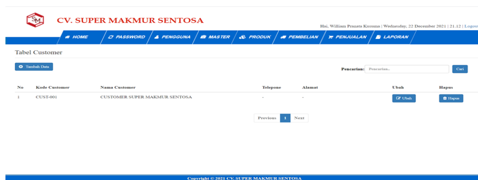
Gambar 5.4 Tampilan Halaman Tabel Customer

Halaman tabel customer merupakan tampilan form yang digunakan untuk melihat data-data customer . Dalam form ini dapat dilakukan tambah data customer , edit data customer , dan hapus data customer . Dibawah ini merupakan tampilan tabel customer :