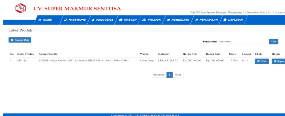
Gambar 5.7 Tampilan Halaman Tabel Produk

Halaman tabel produk merupakan tampilan form yang digunakan untuk melihat data-data produk. Dalam form ini dapat dilakukan tambah data produk, edit data produk, dan hapus data produk. Dibawah ini merupakan tampilan tabel produk: