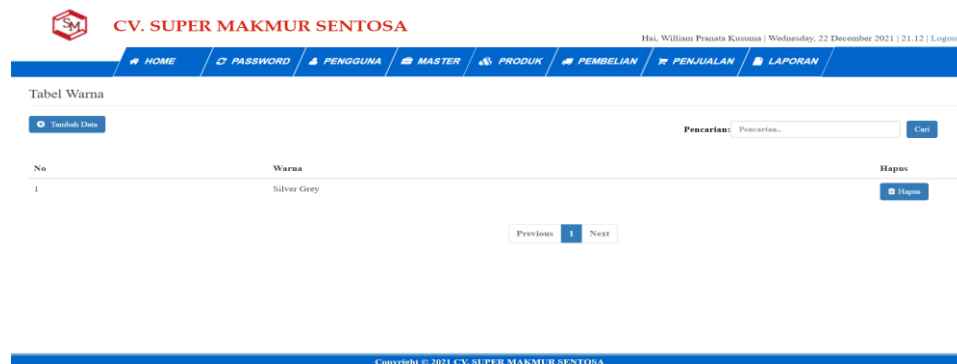
Gambar 5.6 Tampilan Halaman Tabel Warna

Halaman tabel warna merupakan tampilan form yang digunakan untuk melihat data-data warna. Dalam form ini dapat dilakukan tambah data warna, dan hapus data warna. Dibawah ini merupakan tampilan tabel warna: