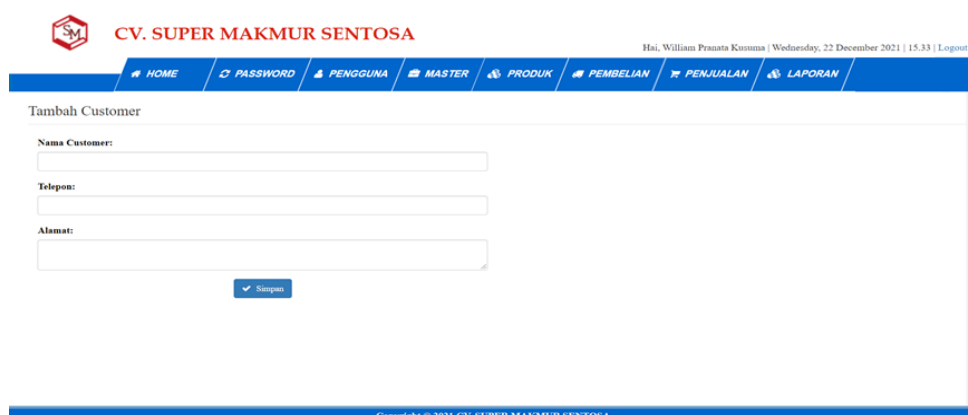
Gambar 5.17 Tampilan Halaman Tambah Customer

Halaman tambah customer merupakan tampilan form yang digunakan pengguna untuk membuat customer baru. Dibawah ini merupakan tampilan halaman tambah customer :