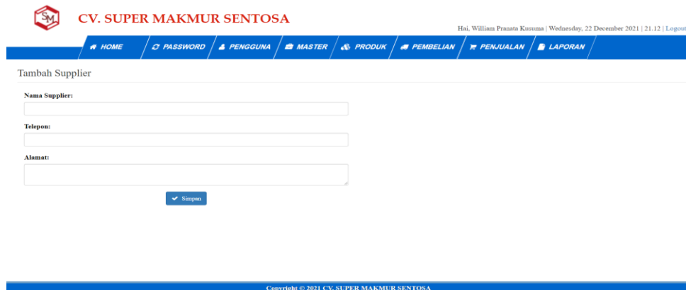
Gambar 5.16 Tampilan Halaman Tambah Supplier

Halaman tambah supplier merupakan tampilan form yang digunakan pengguna untuk membuat supplier baru. Dibawah ini merupakan tampilan halaman tambah supplier: