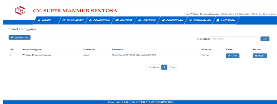
Gambar 5.2 Tampilan Halaman Tabel Pengguna

Halaman tabel pengguna merupakan tampilan form yang digunakan untuk melihat data-data pengguna. Dalam form ini dapat dilakukannya tambah data pengguna, edit data pengguna, dan hapus data pengguna. Dibawah ini merupakan tampilan tabel pengguna: