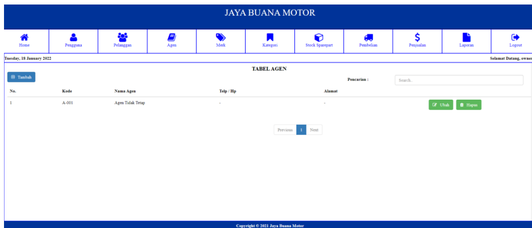
Gambar 5.4 Tampilan Halaman Tabel Agen

Halaman tabel agen merupakan halaman yang diakses oleh agen untuk melihat informasi mengenai agen.