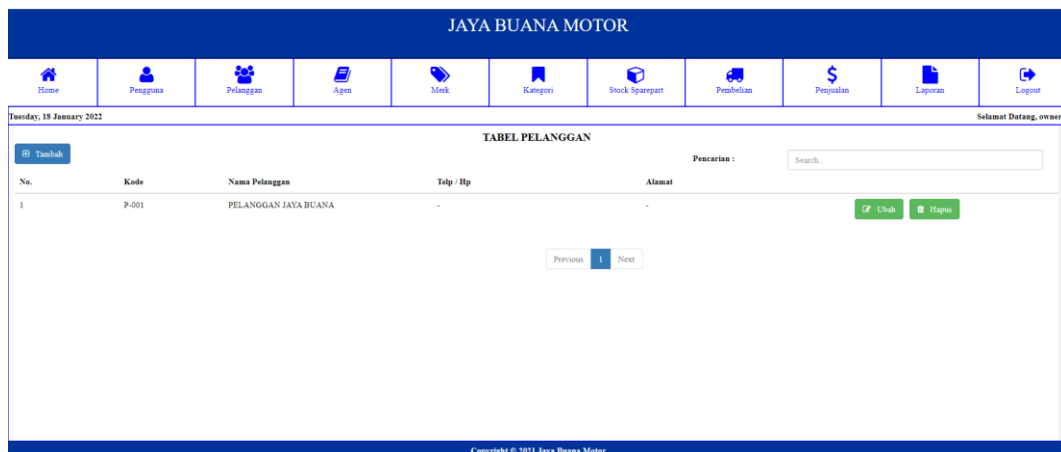
Gambar 5.3 Tampilan Halaman Tabel Pelanggan

Halaman tabel pelanggan merupakan halaman yang diakses oleh pelanggan untuk melihat informasi mengenai pelanggan.