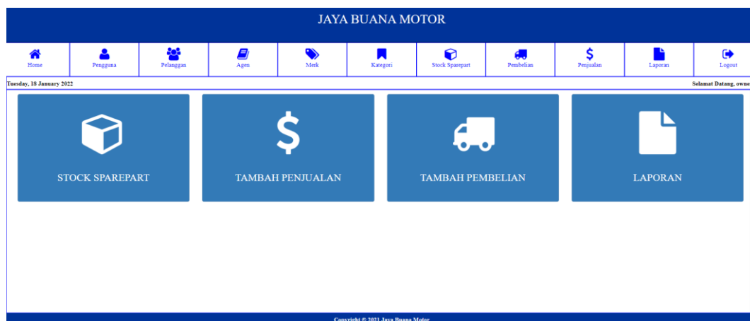
Gambar 5.1 Tampilan Halaman Home

Halaman home merupakan halaman pertama yang dapat diakses oleh pengguna sistem.