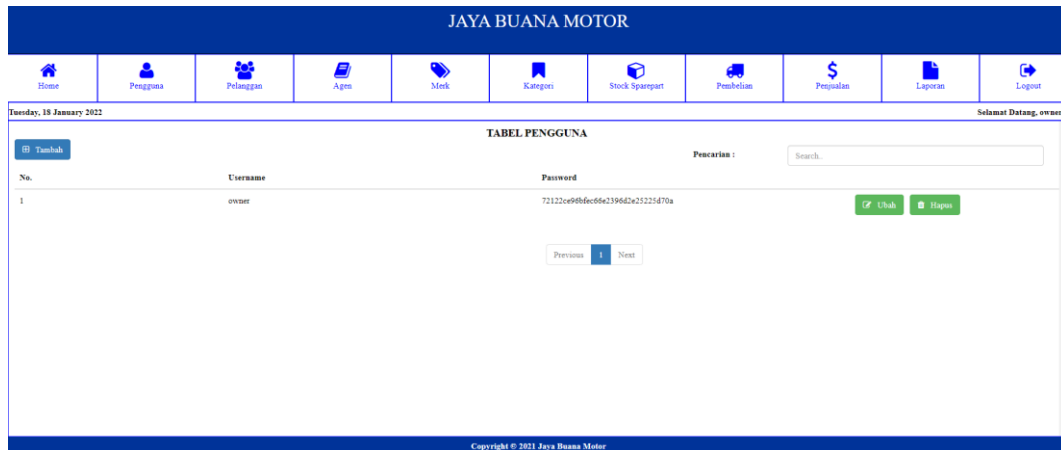
Gambar 5.2 Tampilan Halaman Tabel Pengguna

Halaman tabel pengguna merupakan halaman yang diakses oleh pengguna untuk melihat informasi mengenai pengguna.