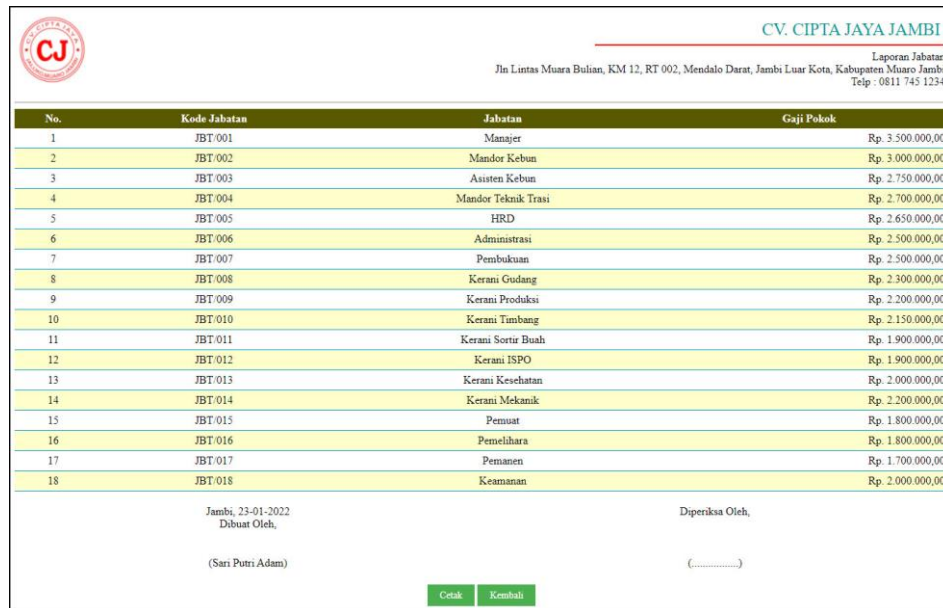
Gambar 5.3 Laporan Jabatan