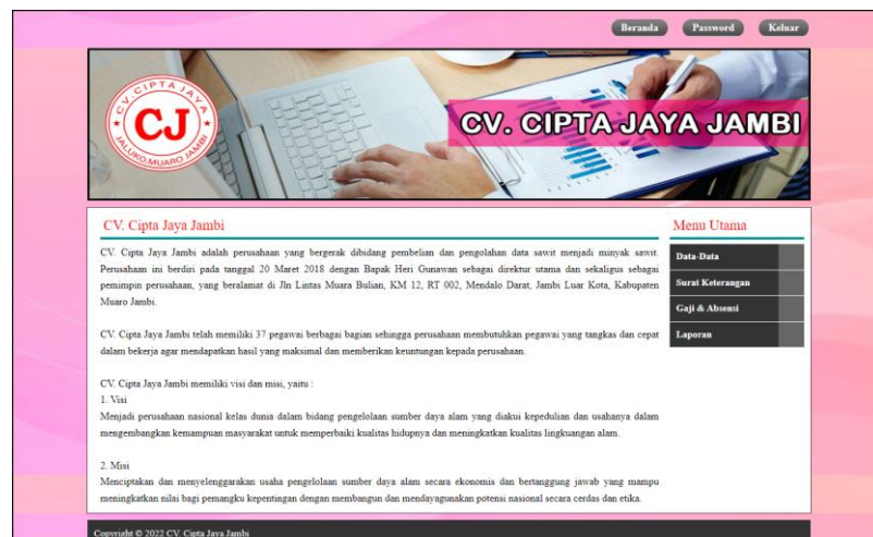
Gambar 5.1 Beranda

Halaman beranda menampilkan informasi mengenai CV. Cipta Jaya Jambi dan terdapat menu-menu untuk membuka halaman lainnya pada sistem. Gambar 5.1 beranda merupakan hasil implementasi dari rancangan pada gambar 4.29.