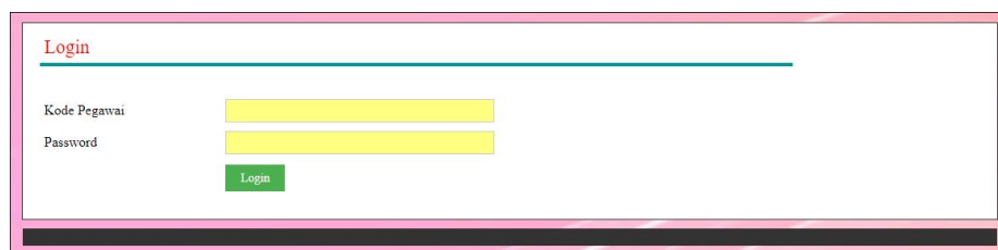
Gambar 5.9 Form Login

Halaman form login merupakan halaman yang digunakan oleh pengguna sistem dalam masuk ke halaman utama dan digunakan oleh perusahaan untuk mendapatkan absensi karyawan dengan mengisi kode pegawai dan password . Gambar 5.9 form login merupakan hasil implementasi dari rancangan pada gambar 4.37.