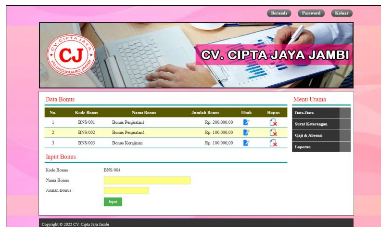
Gambar 5.12 Data Bonus

Halaman data bonus merupakan halaman yang digunakan untuk mengelola data bonus yang terdapat tabel untuk melihat, mengubah, menghapus data dan form untuk menambah data bonus yang baru ke dalam sistem. Gambar 5.12 data bonus merupakan hasil implementasi dari rancangan pada gambar 4.40.