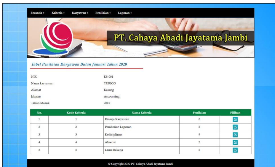
Gambar 5.10 Halaman Tabel Penilaian Karyawan

Halaman tabel penilaian karyawan merupakan halaman yang menampilkan informasi lengkap dari penilaian karyawan dan terdapat pengaturan untuk mengubah data. Gambar 5.10 tabel penilaian karyawan merupakan hasil implementasi dari rancangan pada gambar 4.32.