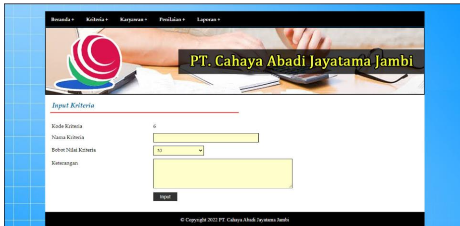
Gambar 5.3 Halaman Input Kriteria