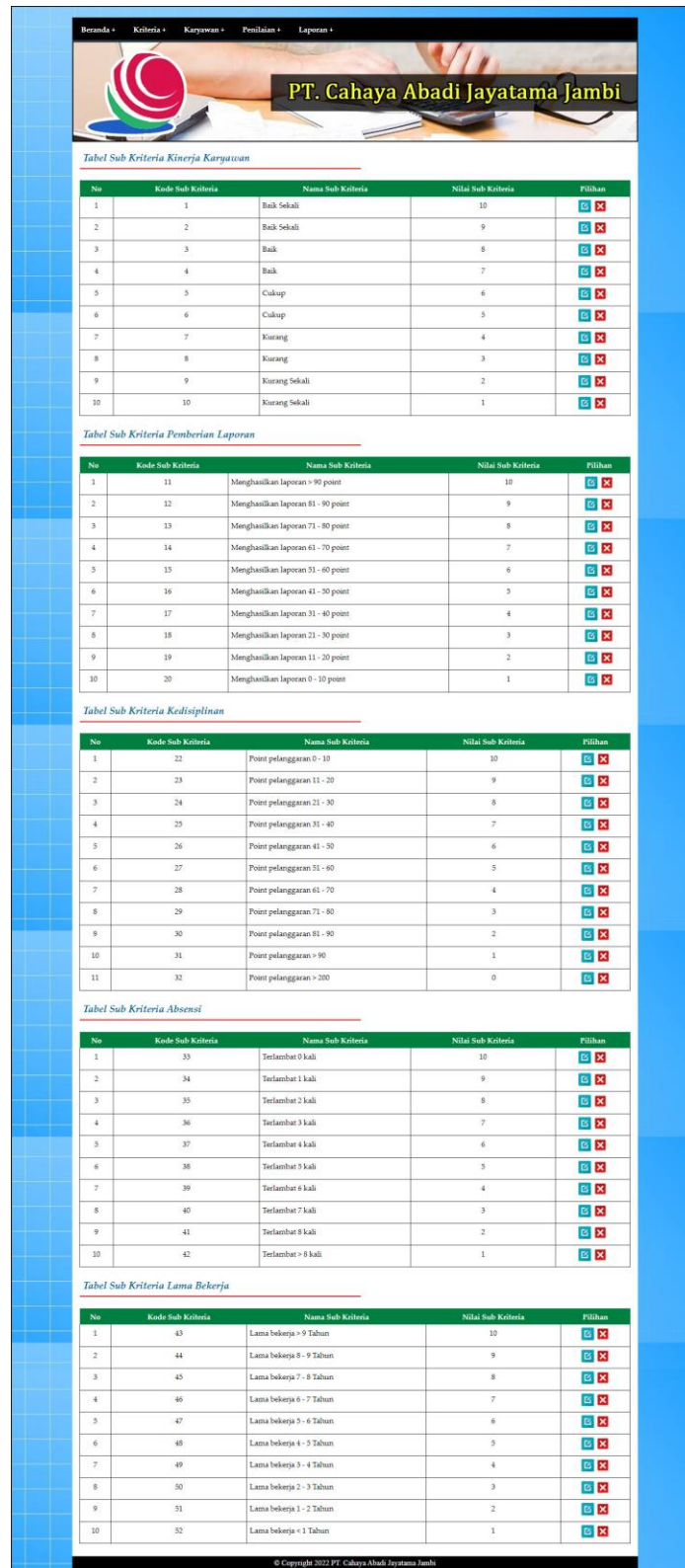
Gambar 5.9 Halaman Tabel Sub Kriteria