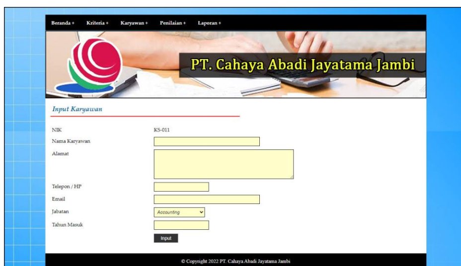
Gambar 5.2 Halaman Input Karyawan

Halaman input karyawan merupakan halaman yang menampilkan form untuk menambah data karyawan baru dengan kolom yang terdiri dari nama karyawan, alamat, telepon / hp, email, jabatan dan tahun masuk. Gambar 5.2 input karyawan merupakan hasil implementasi dari rancangan pada gambar 4.24.