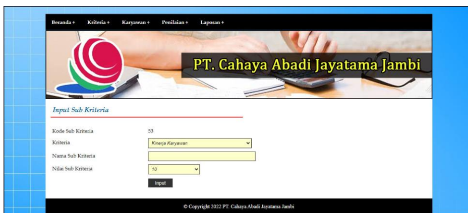
Gambar 5.4 Halaman Input Sub Kriteria

Halaman input sub kriteria merupakan halaman yang menampilkan form untuk menambah data sub kriteria baru dengan kolom yang terdiri dari kriteria, nama sub kriteria, dan nilai sub kriteria. Gambar 5.4 input sub kriteria merupakan hasil implementasi dari rancangan pada gambar 4.26.