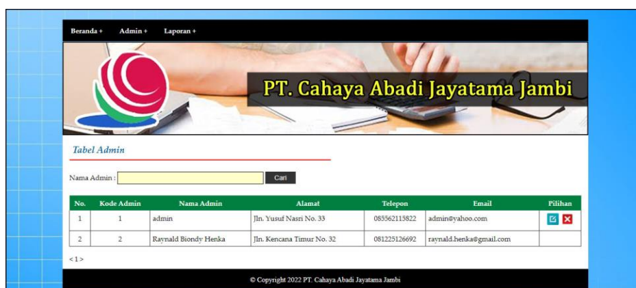
Gambar 5.13 Halaman Tabel Admin

Halaman tabel admin merupakan halaman yang menampilkan informasi lengkap dari admin dan terdapat pengaturan untuk mengubah dan menghapus data. Gambar 5.13 tabel admin merupakan hasil implementasi dari rancangan pada gambar 4.35.