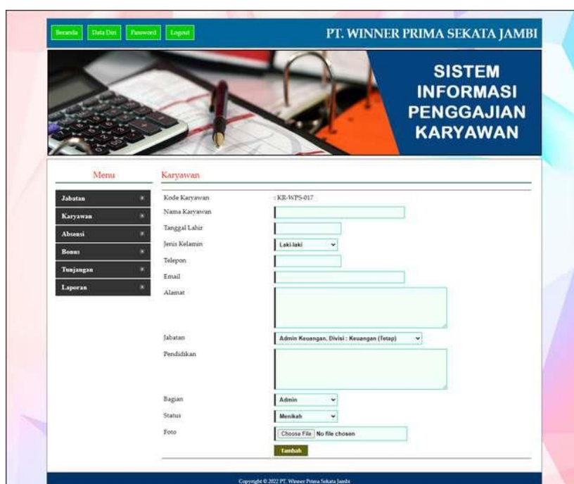
Gambar 5.3 Input Karyawan

Halaman input karyawan merupakan halaman yang digunakan oleh admin keuangan untuk menambah data karyawan baru ke dalam perusahaan dimana admin harus mengisi field seperti nama karyawan, tanggal lahir, jenis kelamin, telepon, email, alamat, jabatan, pendidikan, status dan foto. Gambar 5.3 merupakan hasil implementasi dari rancangan pada gambar 4.30.