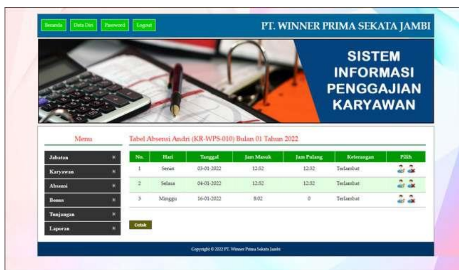
Gambar 5.12 Tabel Absensi

Halaman tabel absensi merupakan halaman yang dapat diakses oleh admin untuk mengelola data absensi dimana berisikan hari, tanggal, jam masuk, jam pulang, keterangan dan link pilihan untuk mengubah dan menghapus data tunjangan sesuai dengan keinginan dari admin. Gambar 5.12 merupakan hasil implementasi dari rancangan pada gambar 4.39.