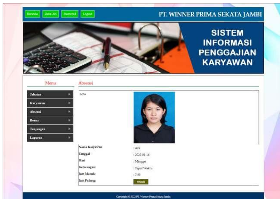
Gambar 5.4 Input Absensi