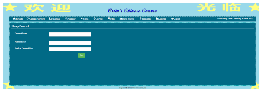
Gambar 5.12 Halaman Change Password

Halaman change password digunakan oleh pengguna sistem untuk membuat mengubah password lama menjadi password baru. Gambar 5.12 merupakan hasil implementasi dari rancangan pada gambar 4.40.