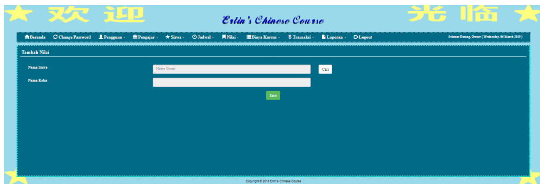
Gambar 5.17 Halaman Tambah Nilai

Halaman tambah nilai merupakan halaman yang digunakan oleh pengguna sistem untuk memasukkan data nilai. Gambar 5.17 merupakan hasil implementasi dari rancangan pada gambar 4.45.