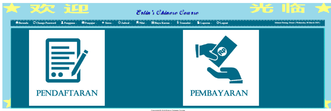
Gambar 5.1 Halaman Home

Halaman home merupakan halaman yang menghubungkan antara sub-menu satu dengan sub-menu lainnya. Gambar 5.1 merupakan hasil implementasi dari rancangan pada gambar 4.29.