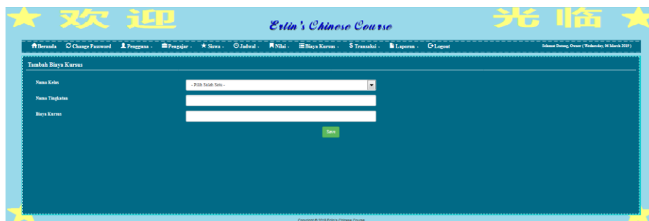
Gambar 5.18 Halaman Tambah Biaya Kursus

Halaman tambah biaya kursus merupakan halaman yang digunakan oleh pengguna sistem untuk membuat data biaya. Gambar 5.18 merupakan hasil implementasi dari rancangan pada gambar 4.46.