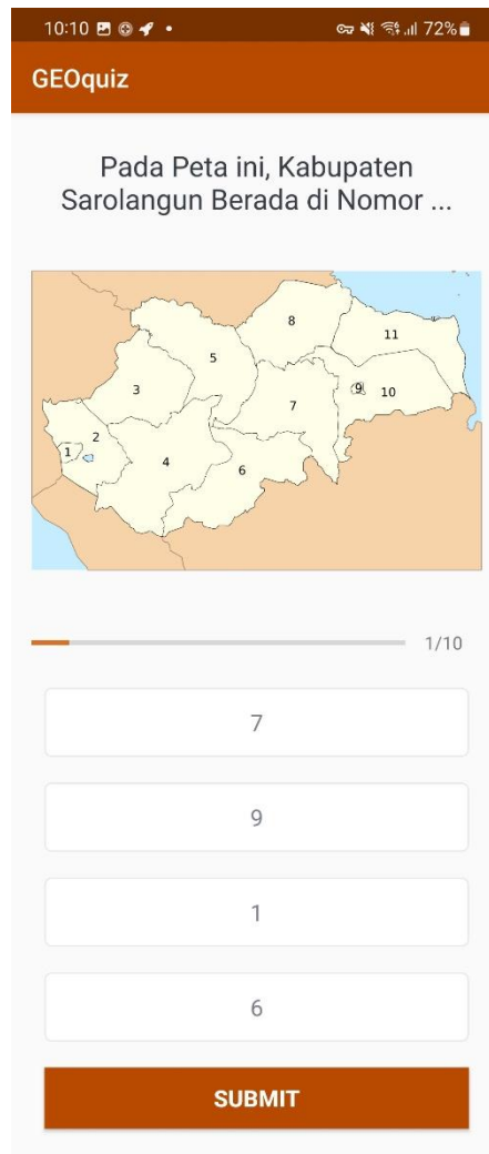
Gambar 5.3 Implementasi Halaman Quiz