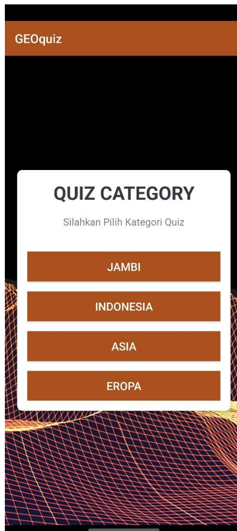
Gambar 5.2 Implementasi Kategori Quiz