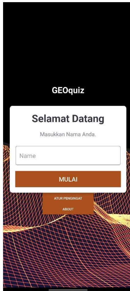
Gambar 5.1 Implementasi Halaman Nama