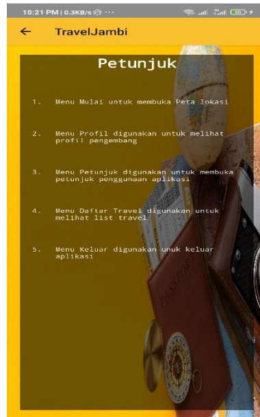
Gambar 5.8 Interface Halaman Petunjuk

Halaman interface petunjuk digunakan ketika pengguna akan melihat petunjuk penggunaan aplikasi travel Jambi. Berikut gambar implementasi halaman petunjuk dapat dilihat pada gambar 5.8