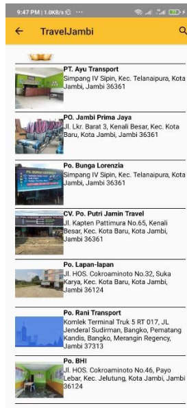
Gambar 5.3 Halaman Daftar Travel

Halaman interface daftar travel digunakan ketika pengguna akan melihat data travel dalam bentuk daftar. Berikut gambar implementasi halaman daftar travel dapat dilihat pada gambar 5.3