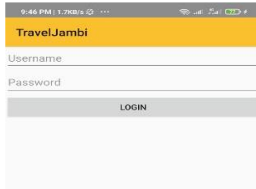
Gambar 5.5 Halaman login

Halaman interface login digunakan pengguna dalam halaman login pengembang. Berikut gambar implementasi halaman login dapat dilihat pada gambar 5.5