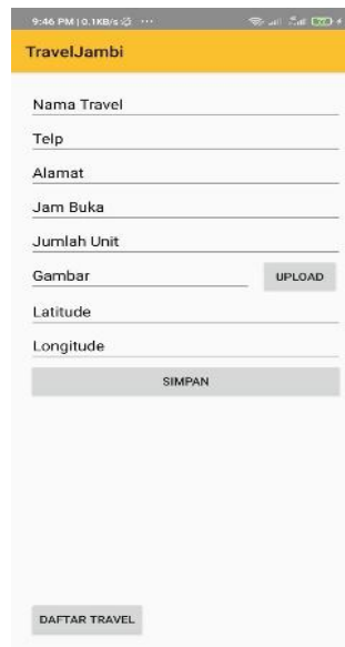
Gambar 5.6 Halaman Tambah Travel