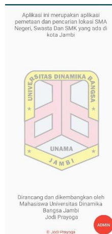
Gambar 5.6 Implementasi Halaman Tentang Aplikasi

Halaman ini berisi informasi aplikasi, pada halaman ini juga terdapat opsi untuk login sebagai admin. Dapat dilihat pada gambar 5.6 berikut, gambar berikut merupakan hasil implementasi dari rancangan 4.24.