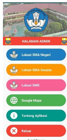
Gambar 5.8 Implementasi Halaman Utama Admin

Halaman ini merupakan halamn utama admin yang hanya bisa di akses setelah admin melakukan login . Dapat dilihat pada gambar 4.8 berikut, gambar berikut merupakan hasil implementasi dari rancangan 4.26.