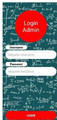
Gambar 5.7 Implementasi Halaman Login Admin

Halaman ini merupakan di gunakan admin untuk login sebagai status admin. Dapat dilihat pada gambar 5.7 berikut, gambar berikut merupakan hasil implementasi dari rancangan 4.25.