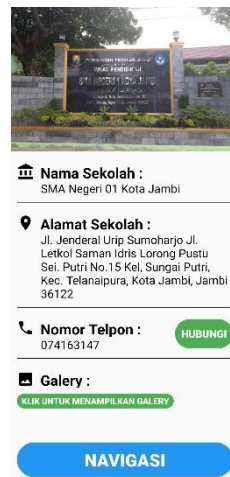
Gambar 5.4 Implementasi Halaman Informasi Lokasi SMA-N/S/SMK