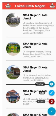
Gambar 5.9 Implementasi Halaman List Lokasi SMA-N/S/SMK Admin