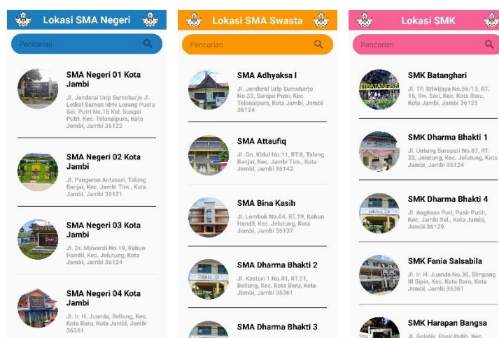
Gambar 5.3 Implementasi Halaman List Lokasi SMA-N/S/SMK

Halaman ini akan muncul apabila pengguna memilih menu list lokasi SMA-N/S/SMK pada halaman utama aplikasi. Dapat dilihat pada gambar 5.3 berikut, gambar berikut merupakan hasil implementasi dari rancangan gambar 4.21.