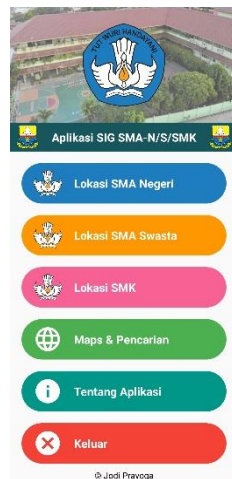
Gambar 5.2 Implementasi Halaman Utama

Pada halaman ini berisi menu-menu yang tersedia pada aplikasi. Dapat dilihat pada gambar 5.2 berikut, gambar berikut merupakan hasil implementasi dari rancangan gambar 4.20.