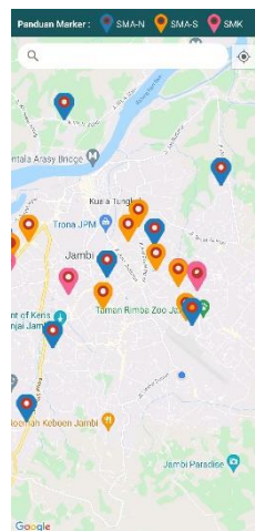
Gambar 5.5 Implementasi Halaman Google Maps

Halaman ini merupakan halaman google maps view yang sudah dilengkapi dengan marker lokasi-lokasi SMA Negeri, swasta, dan SMK. Dapat dilihat pada gambar 5.5 berikut, gambar berikut merupakan hasil implementasi dari rancangan 4.23.