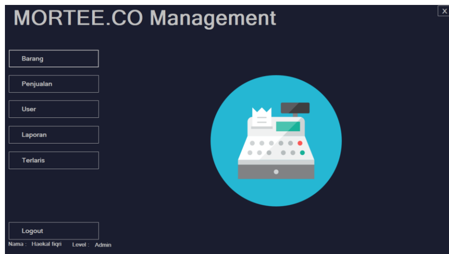
Gambar 5.2 Halaman Menu Utama

Halaman beranda merupakan tampilan awal digunakan pengguna sistem setelah melakukan login dengan dapat mengakses ke halaman lainnya dan terdapat menu-menu untuk menampilkan halaman lainnya. Gambar 5.2 merupakan hasil implementasi dari rancangan pada gambar 4.23