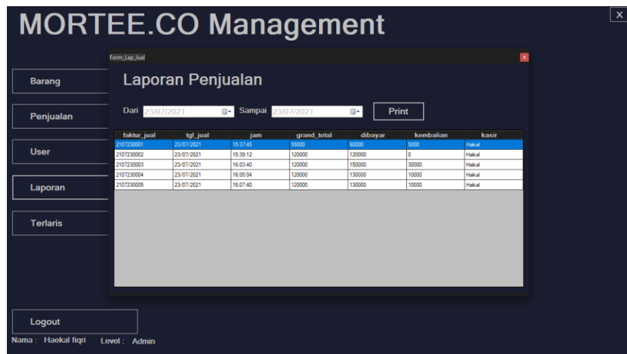
Gambar 5.7 Halaman Laporan