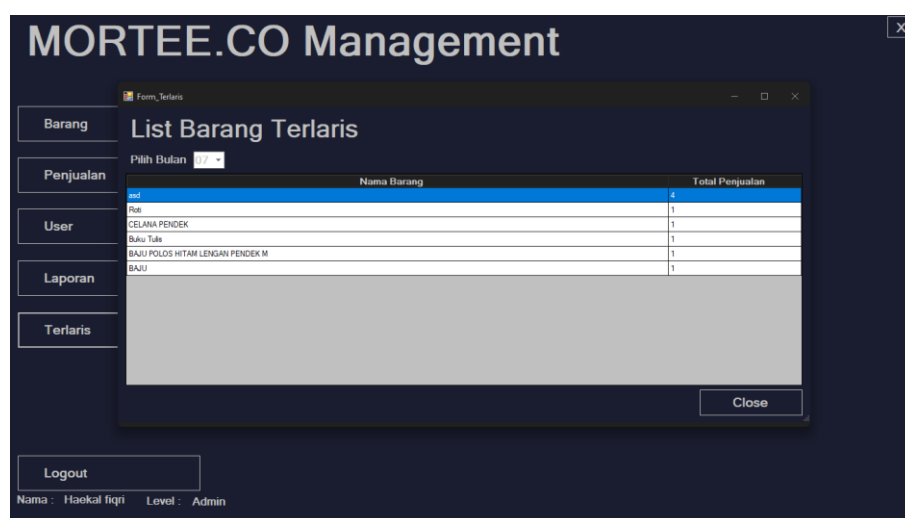
Gambar 5.9 Halaman Terlaris

Halaman Terlaris merupakan halaman yang digunakan untuk melihat penjualan barang mana yang banyak sampai yang sedikit terjual. Gambar 5.9 tambah penjualan merupakan hasil implementasi dari rancangan pada gambar 4.30