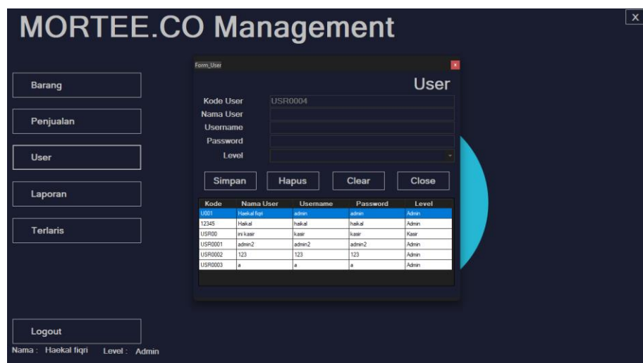
Gambar 5.8 Halaman Users

Halaman users merupakan halaman yang digunakan untuk mengelola data users seperti tambah edit dan hapus. Gambar 5.8 halaman users merupakan hasil implementasi dari rancangan pada gambar 4.29