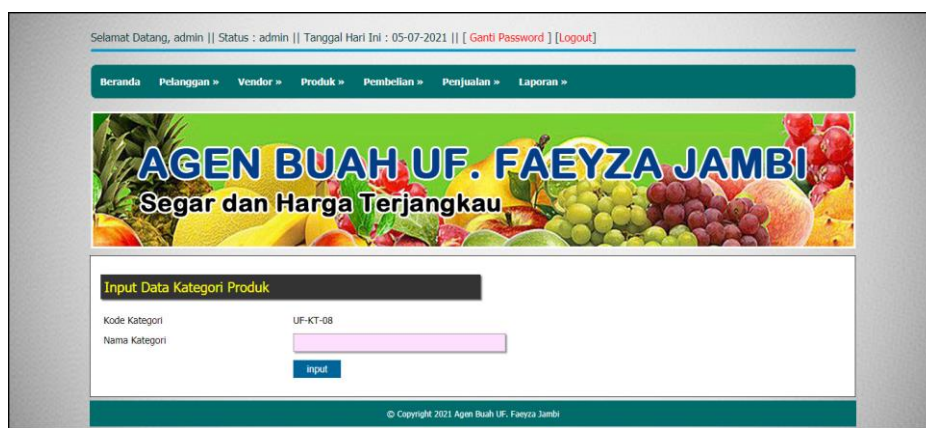
Gambar 5.4 Halaman Input Kategori Produk

Halaman input kategori produk merupakan halaman yang digunakan admin untuk menambah data kategori produk dengan mengisi nama kategori produk di kolom yang tersedia. Gambar 5.4 input kategori produk merupakan hasil implementasi dari rancangan pada gambar 4.30.