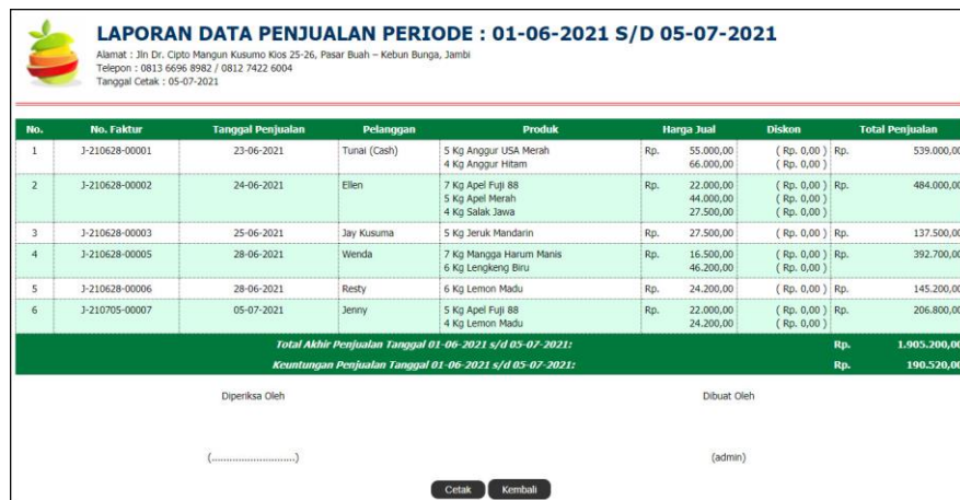
Gambar 5.20 Halaman Laporan Penjualan