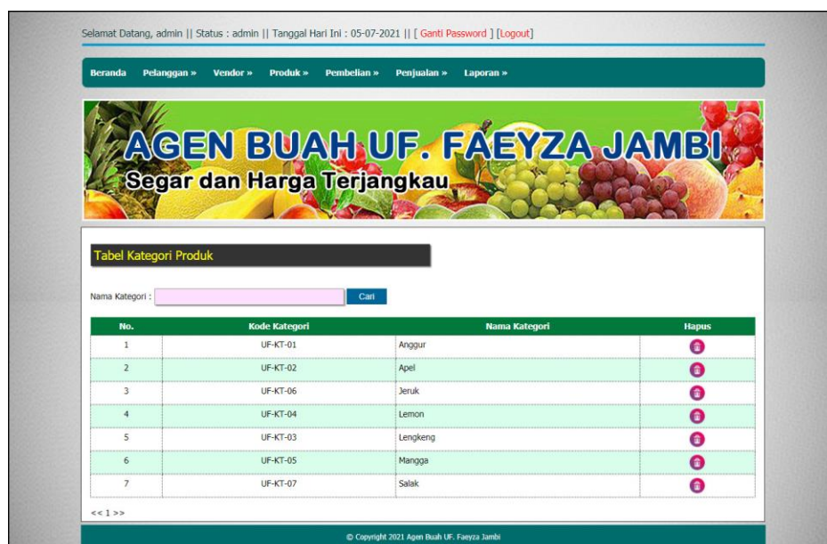
Gambar 5.13 Halaman Tabel Kategori Produk

Halaman tabel kategori produk merupakan halaman yang digunakan untuk mengelola data kategori produk dengan menampilkan informasi mengenai kategori produk dan terdapat link untuk menghapus data kategori produk. Gambar 5.13 tabel kategori produk merupakan hasil implementasi dari rancangan pada gambar 4.39.