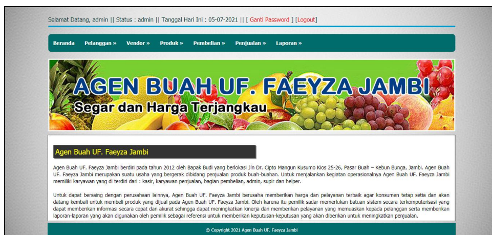
Gambar 5.10 Halaman Halaman Beranda

Halaman beranda merupakan halaman pertama setelah admin atau karyawan melakukan login dimana halaman ini menampilkan gambaran umum dari perusahaan, cara penggunaan sistem dan terdapat menu-menu untuk menampilkan informasi yang lain. Gambar 5.10 beranda admin merupakan hasil implementasi dari rancangan pada gambar 4.36