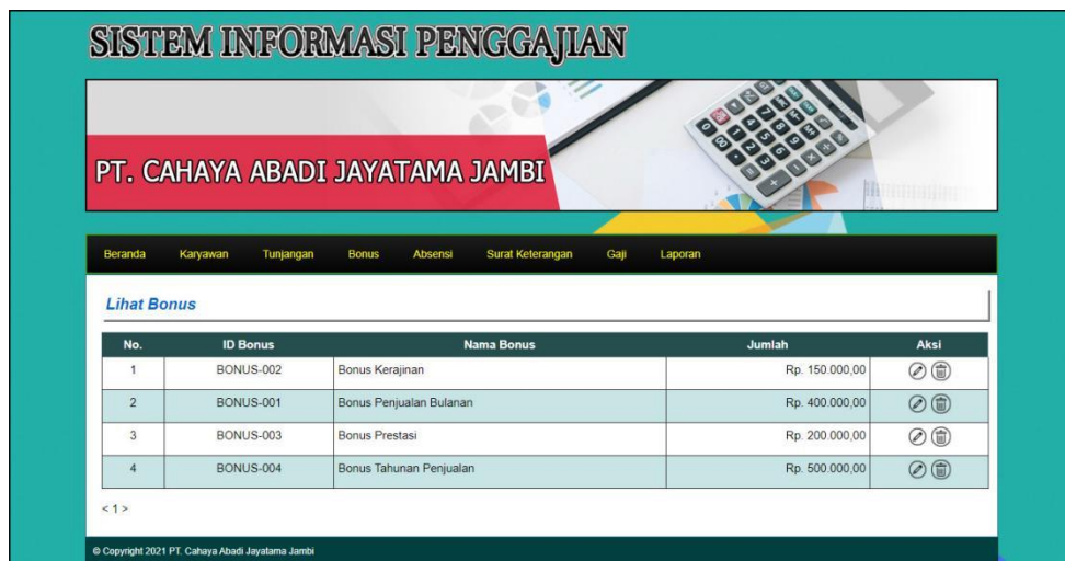
Gambar 5.5 Halaman Lihat Bonus

Halaman lihat bonus menampilkan informasi mengenai data bonus yang terdiri dari id bonus, nama bonus, jumlah dan aksi untuk mengubah dan menghapus data. Gambar 5.5 lihat bonus merupakan hasil implementasi dari rancangan pada gambar 4.33.