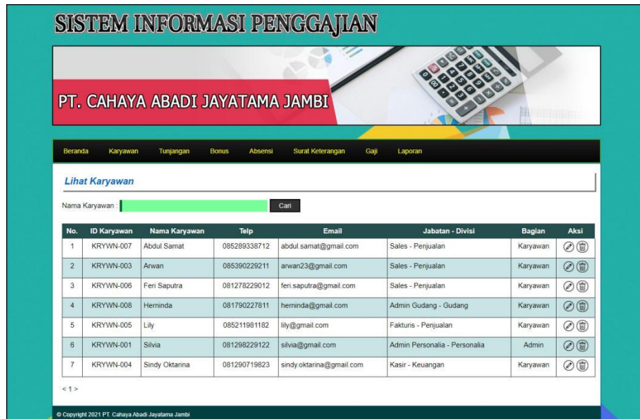
Gambar 5.3 Halaman Lihat Karyawan