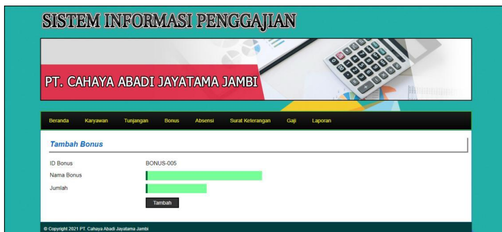
Gambar 5.15 Halaman Tambah Bonus

Halaman tambah bonus merupakan halaman yang menampilkan form untuk menambah data bonus yang baru ke dalam sistem. Gambar 5.15 tambah bonus merupakan hasil implementasi dari rancangan pada gambar 4.43.