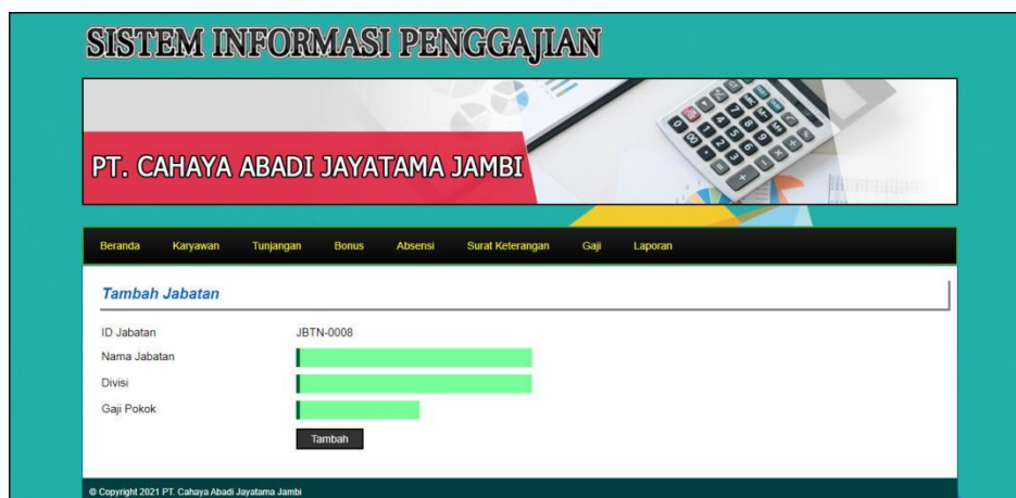
Gambar 5.12 Halaman Tambah Jabatan

Halaman tambah jabatan merupakan halaman yang menampilkan form untuk menambah data jabatan yang baru ke dalam sistem. Gambar 5.12 data jabatan merupakan hasil implementasi dari rancangan pada gambar 4.40.