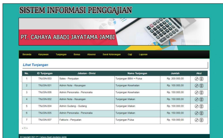
Gambar 5.4 Halaman Lihat Tunjangan

Halaman lihat tunjangan menampilkan informasi mengenai data tunjangan yang terdiri dari id tunjangan, jabatan – divisi, nama tunjangan, jumlah dan aksi untuk mengubah dan menghapus data. Gambar 5.4 lihat tunjangan merupakan hasil implementasi dari rancangan pada gambar 4.32.