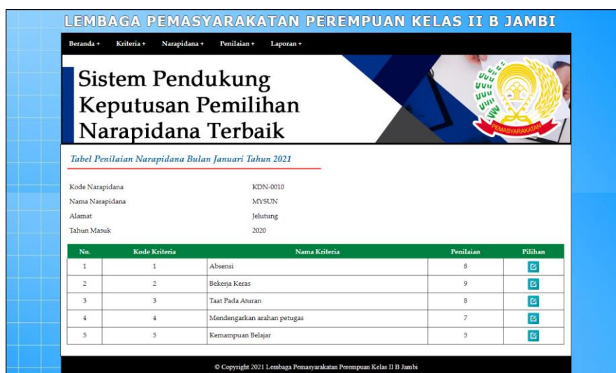
Gambar 5.10 Halaman Tabel Penilaian Narapidana

Halaman tabel penilaian narapidana merupakan halaman yang menampilkan informasi lengkap dari penilaian narapidana dan terdapat pengaturan untuk mengubah data. Gambar 5.10 tabel penilaian narapidana merupakan hasil implementasi dari rancangan pada gambar 4.32.