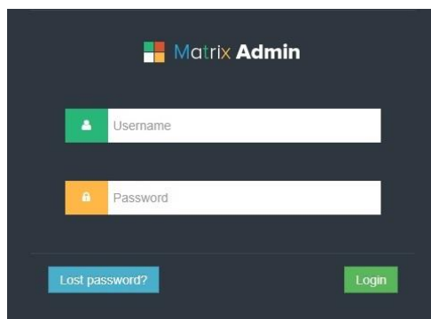
Gambar 5.1 Login

Halaman login merupakan halaman yang menampilkan kolom nama admin dan password yang digunakan untuk admin dapat masuk ke halaman utamanya. Gambar 5.1 login merupakan hasil implementasi dari rancangan pada Gambar 4.3 , sedangkan listing code program PHP ada pada lampiran..