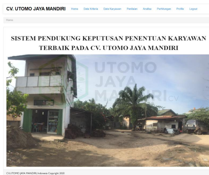
Gambar 5.7 Dashboard

Halaman Dashboard merupakan halaman beranda yang tampil setelah user telah melakukan login, terdapat berbagai sub menu yang dapat diklik sesuai dengan keinginan user. Gambar 5.2 merupakan hasil implementasi rancangan pada gambar 5.7 merupakan hasil rancangan pada gambar 4.21.