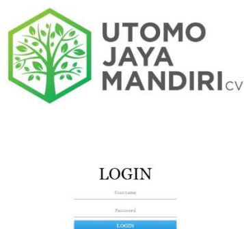
Gambar 5.1 Halaman Login

Halaman Login merupakan halaman pertama kali yang tampil pada halaman admin, dan pimpinan guna untuk melakukan login . Admin dan pimpinan melakukan login dengan mengisi username dan password . Gambar 5.1 merupakan hasil implemementasi dari rancangan sistem pada gambar 4.15.