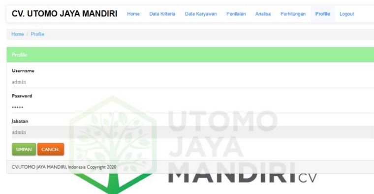
Gambar 5.6 Profile