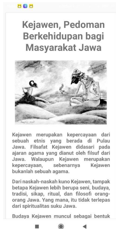
Gambar 5.6 Halaman Kejawen