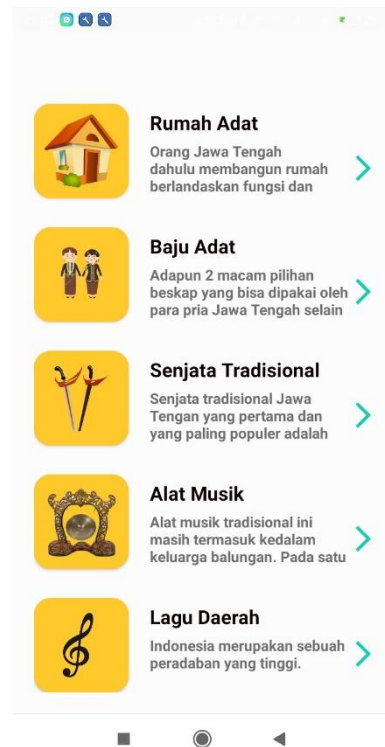
Gambar 5.7 Halaman Kebudayaan Jawa Tengah