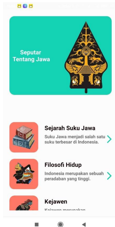
Gambar 5.3 Halaman Tentang Jawa