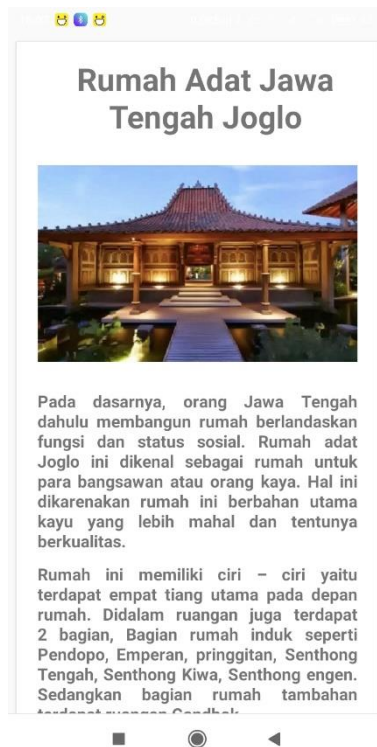
Gambar 5.8 Halaman Rumah Adat