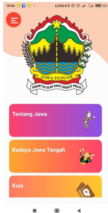
Gambar 5.2 Halaman Utama