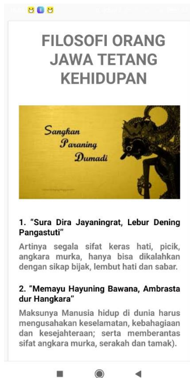
Gambar 5.5 Halaman Filosofi Hidup