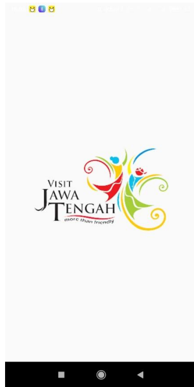
Gambar 5.1 Halaman Pembuka