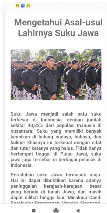
Gambar 5.4 Halaman Sejarah Suku Jawa