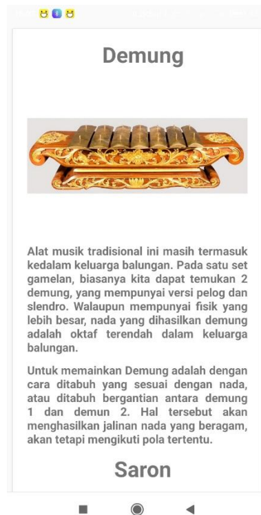
Gambar 5.11 Halaman Alat Musik