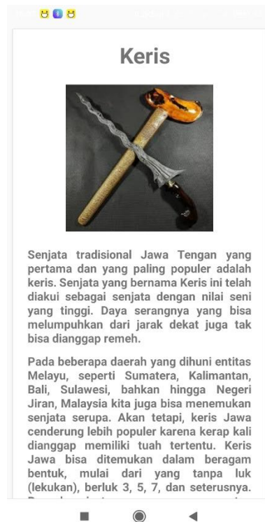
Gambar 5.10 Halaman Senjata Tradisional