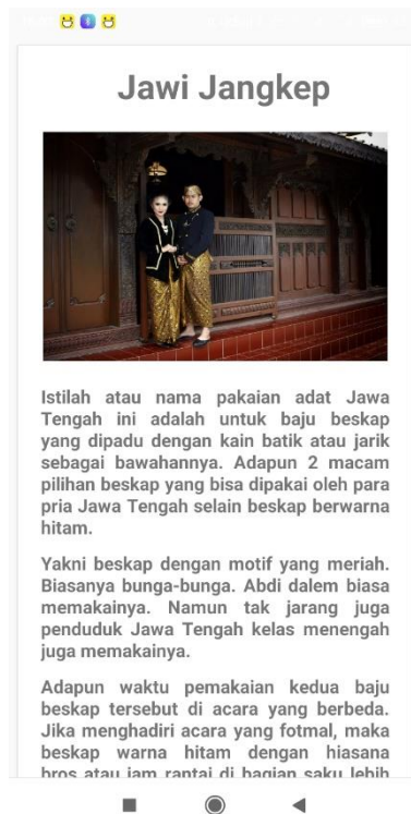
Gambar 5.9 Halaman Baju Adat